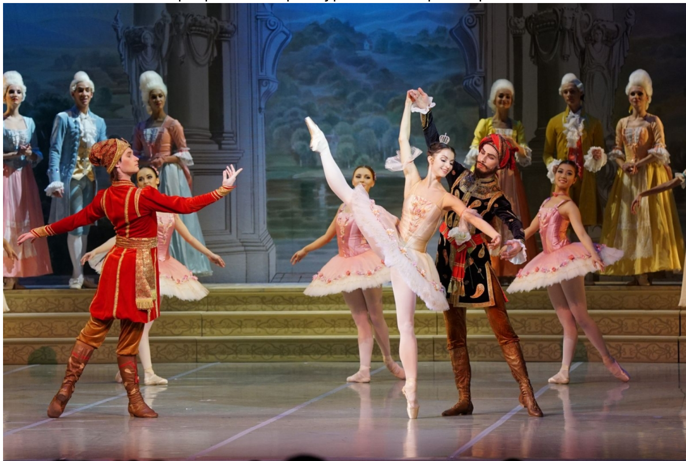
Сцена из спектакля "Спящая красавица"

октябре 2016 года, стал первым опытом сотрудничества Театра с известным французским хореографом, педагогом и танцовщиком Парижской Оперы Жаном-Гийомом Баром, в свое время получившим в Париже звание Danseur Etoile именно за партию Принца Дезира. Это была уже вторая работа Бара в России – в 2007 году он постановил балет «Корсар» в Екатеринбургском театре оперы и балета.