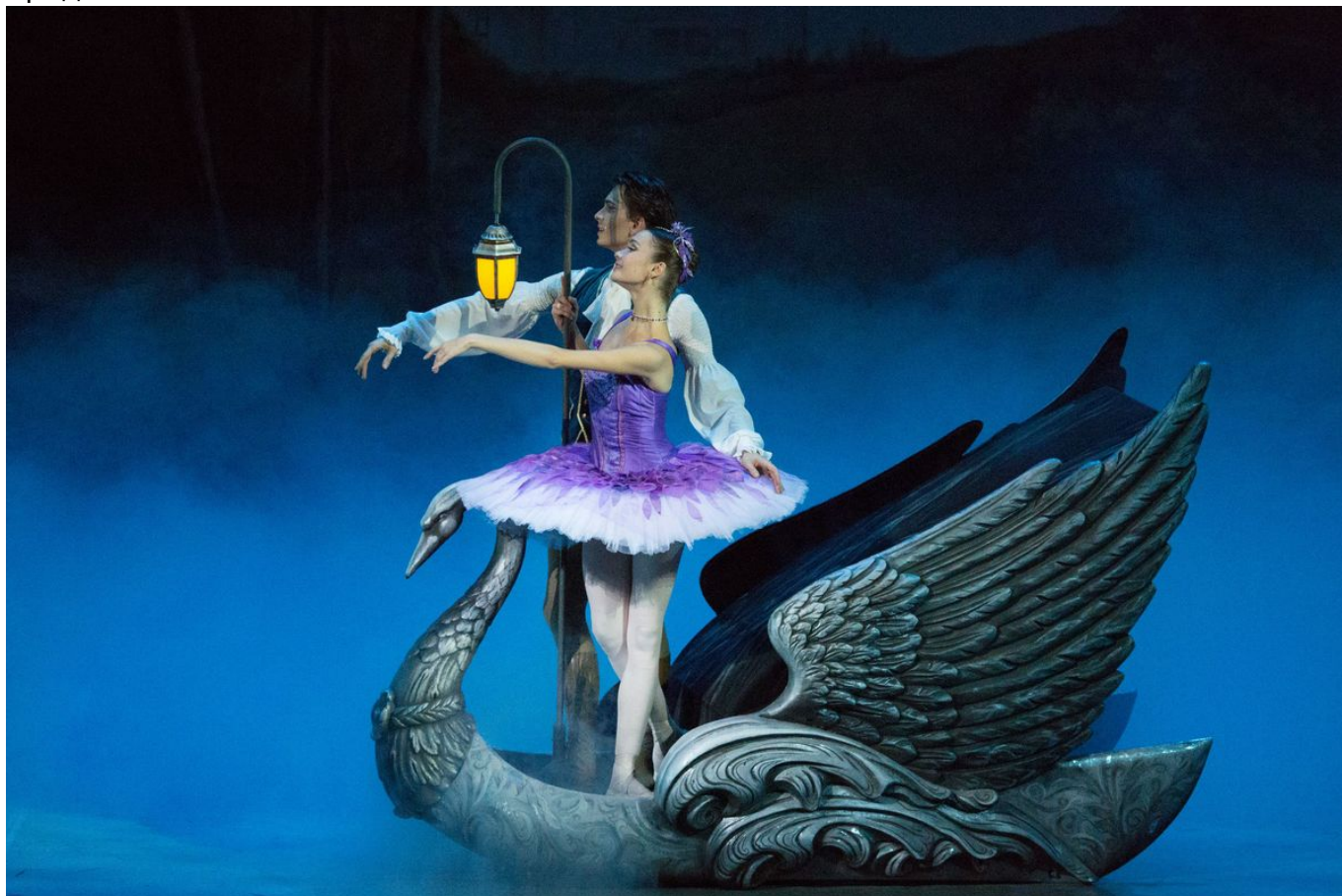
Сцена из спектакля "Спящая красавица"

Думаем, комментарии излишни. Жаль лишь, что, действительно, проект жизни удалось реализовать лишь к ее закату – Леонид Вениаминович руководил театром неполных семь лет, до самой смерти. После его ухода в 1976 году место художественного руководителя получил его последователь, премьер тогда еще Кировского театра Аскольд Макаров. Именно при нем в театре появились постановки зарубежных хореографов, масштабные классические полотна, пришла известность за пределами СССР.