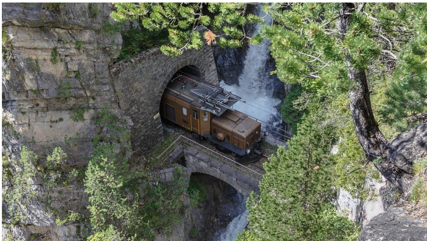
Вот так выглядит «Швейцарский крокодил»

В состав поезда, который до конца октября будет дважды в день курсировать между Давосом и Филизуром по Ретийской железной дороге, входят столетние вагоны 1-го и 2-го классов, открытые панорамные вагоны, вагоны для перевозки велосипедов и построенный в 1929 году «Крокодил». «Швейцарскими крокодилами» или просто «Крокодилами» называют электрические локомотивы с удлиненными капотами, похожими на пасть аллигаторов. Сходство с рептилиями усиливается за счет зеленовато-коричневой окраски. Этот тип электровозов производился в 20-х годах прошлого века, но до сих пор исправно работает – как тут не вспомнить о знаменитом швейцарском качестве! В некоторых составах исторического поезда используется полувековой локомотив Ge 4/4 I красного цвета – первый электровоз с индивидуальным приводом колёсных пар.