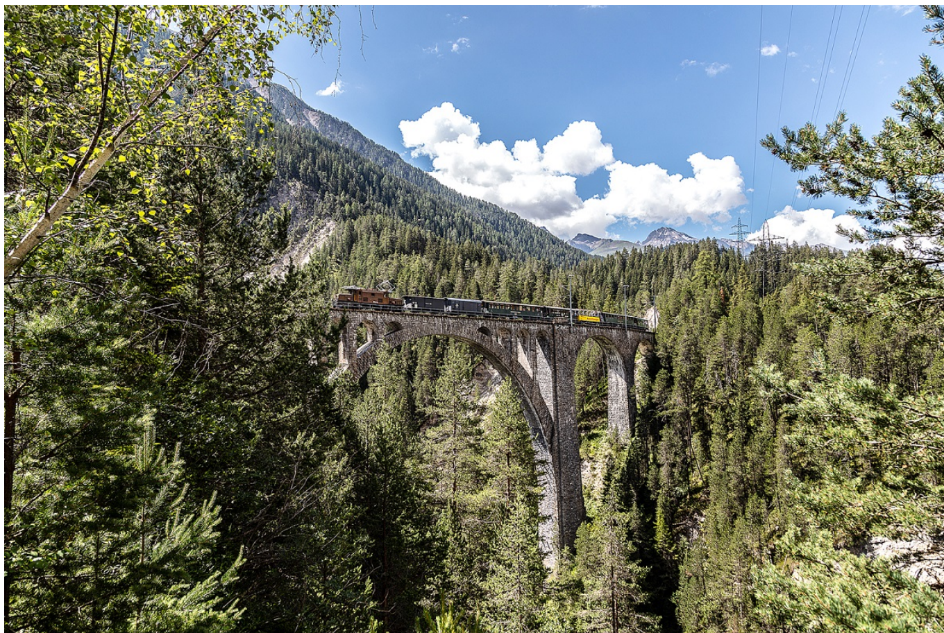
Визенский виадукт

Auteur: Зарина Салимова, Давос , 24.05.2019.