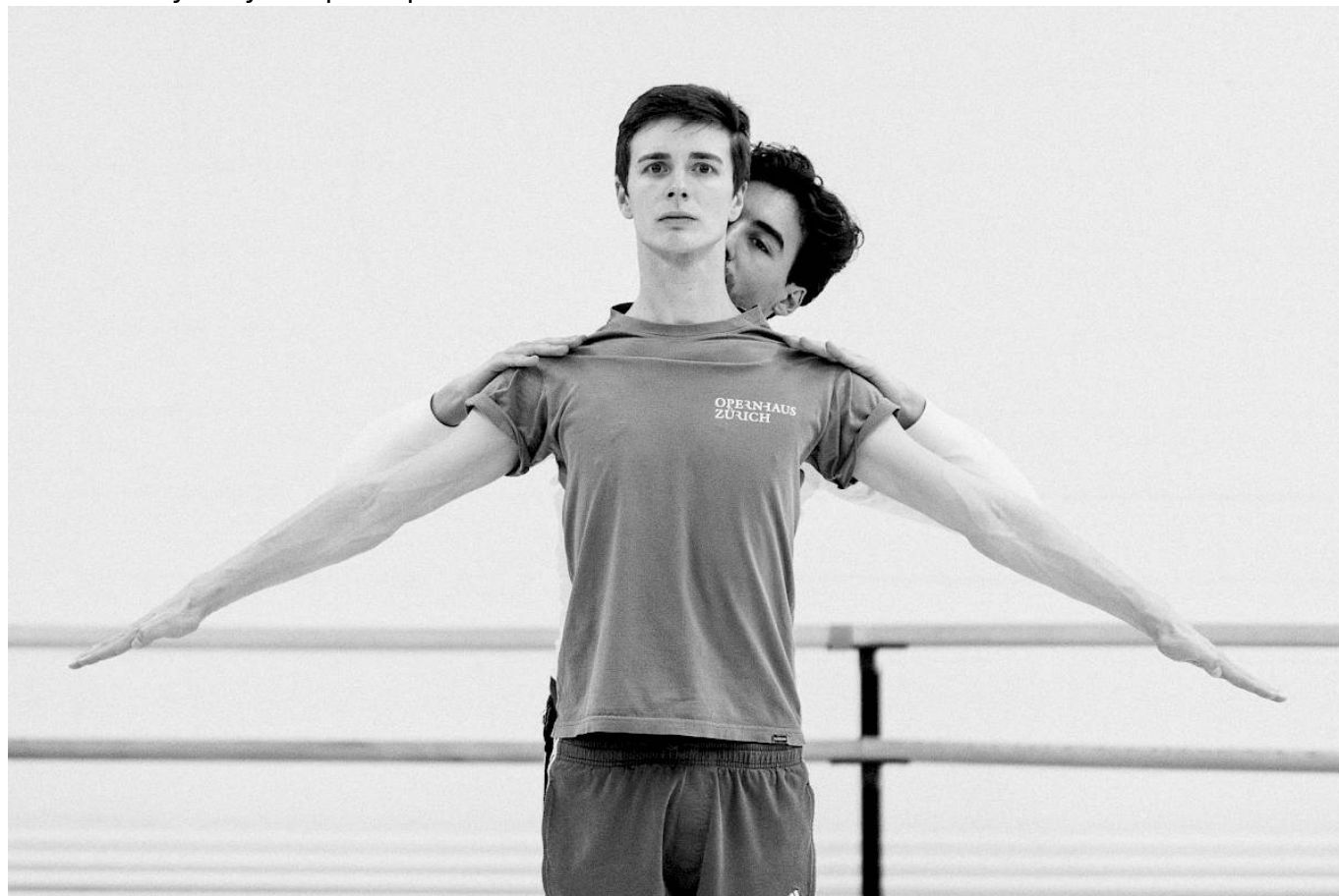
На репетиции балета "Нижинский" в Цюрихском оперном театре

Талант и образ Нижинского вдохновлял и вдохновляет многих деятелей искусства. Ему посвящали свои хореографии Морис Бежар («Нижинский, клоун Божий», 1971) и Джон Ноймайер («Вацлав», 1979, и «Павильон Армиды», 2009). Михаил Барышников станцевал Нижинского в спектакле Роберта Уилсона «Письмо человеку» по мотивам дневников танцовщика (2018), а Сергей Полунин – в балете «Sacre» хореографа Юка Оиши на музыку Игоря Стравинского.