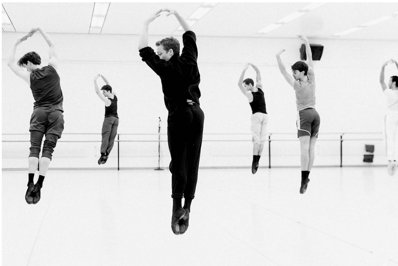
На репетиции балета "Нижинский" в Цюрихском оперном театре

С марта 1905 года педагог-новатор училища, Михаил Фокин, ставил ответственный экзаменационный балет для выпускников. Это был его первый балет в качестве балетмейстера, — он выбрал «Ацис и Галатея». На роль фавна Фокин пригласил Нижинского, хотя тот и не был выпускником. В воскресенье, 10 апреля 1905 года, в Мариинском театре состоялось показательное выступление, после которого в газетах появились рецензии, и во всех отмечали необыкновенную одарённость юного Нижинского.