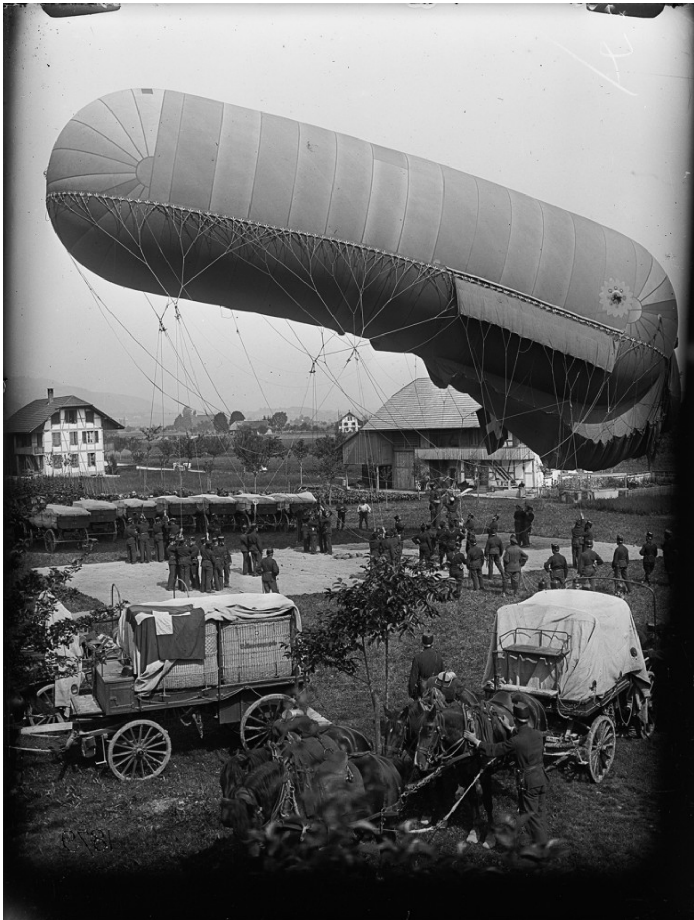
«Федеральная сосиска». Фото: Johann Granz, 1913 © Swisstopo

Конец романтическим путешествиям на воздушных шарах положила Первая мировая война: военные цеппелины и самолеты захватили небо, не оставив в нем места для хрупких шаров. Спелтерини потерял источник заработка, обнищал и умер в 1931