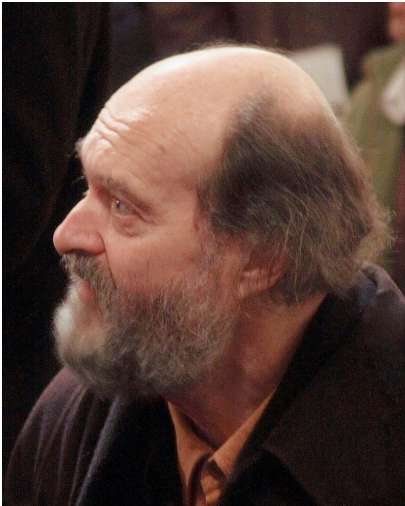
Композитор Арво Пярт (Википедия)

В 1976 году Пярт создал авторский стиль – tintinnabuli (от лат. «колокольчик») – подразумевающий небольшие церковные колокола и узнаваемый в его самых известных работах, таких как Für Alina и Spiegel im Spiegel . (Предвидя возможные комментарии наших сведущих читателей, уточняем, что латинское слово