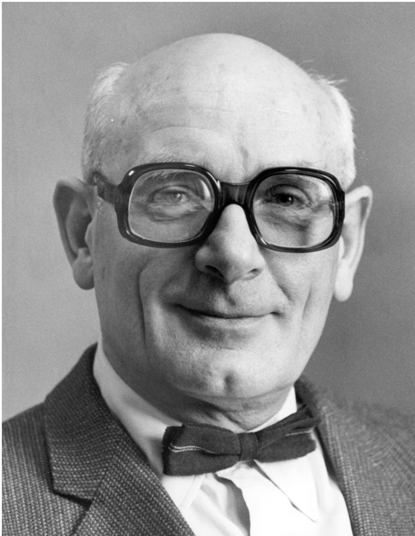
Петер Загер

В связи с антисоветской деятельности самого Загера в Швейцарии вопрос о зарубежном финансировании тоже поднимался, о чем Загер писал: «Позже все равно повторялось шаткое подозрение в том, что я получал деньги от ЦРУ». Причиной слухов было знакомство Загера в США с Алленом У. Даллесом , влиятельным