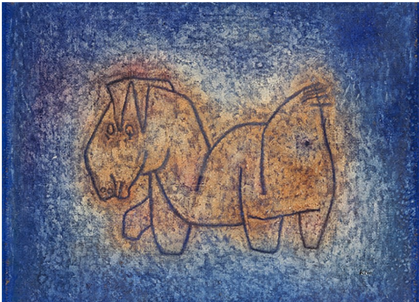
Paul Klee, Bastard, 1939 (c) ZPK

Auteur: Зарина Салимова, Берн , 26.10.2018.