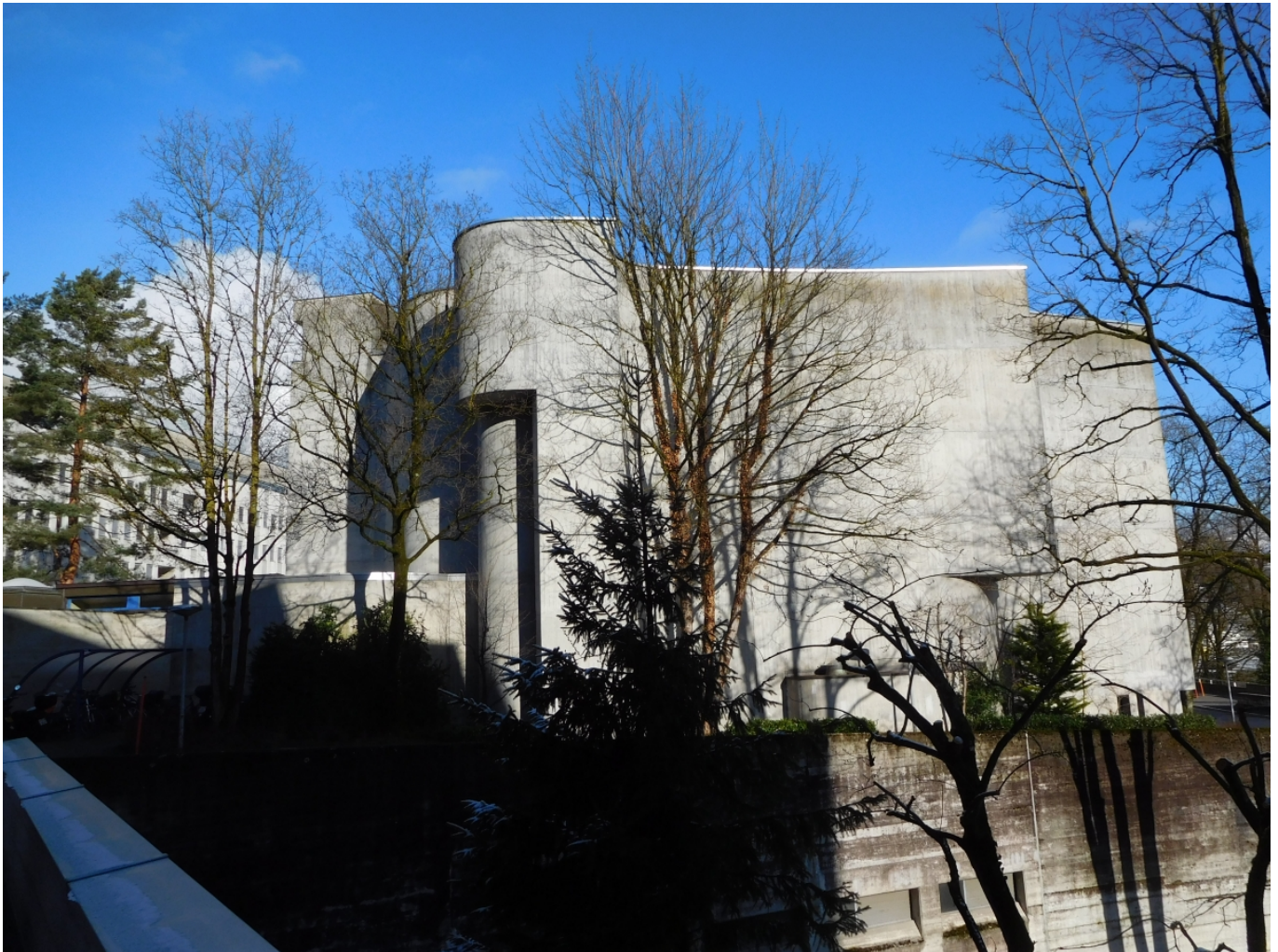
Современная бетонная церковь в Ингенболе, кантон Швиц

Мы уже не раз рассказывали о массовой культурной акции, охватывающей 50 стран и проходящей в Швейцарии с 1994 года. Ее основная цель – привлечь внимание публики к важным историческим памятникам и познакомить ее с профессиями и технологиями, необходимыми для их сохранения. Средство привлечения обычное – бесплатный вход и, в ряде случаев, эксклюзивность. Согласно имеющейся статистике, в общей сложности предоставленной возможностью с радостью пользуются ежегодно около 20 миллионов человек. На наш взгляд, для 50 стран цифра не слишком впечатляющая.