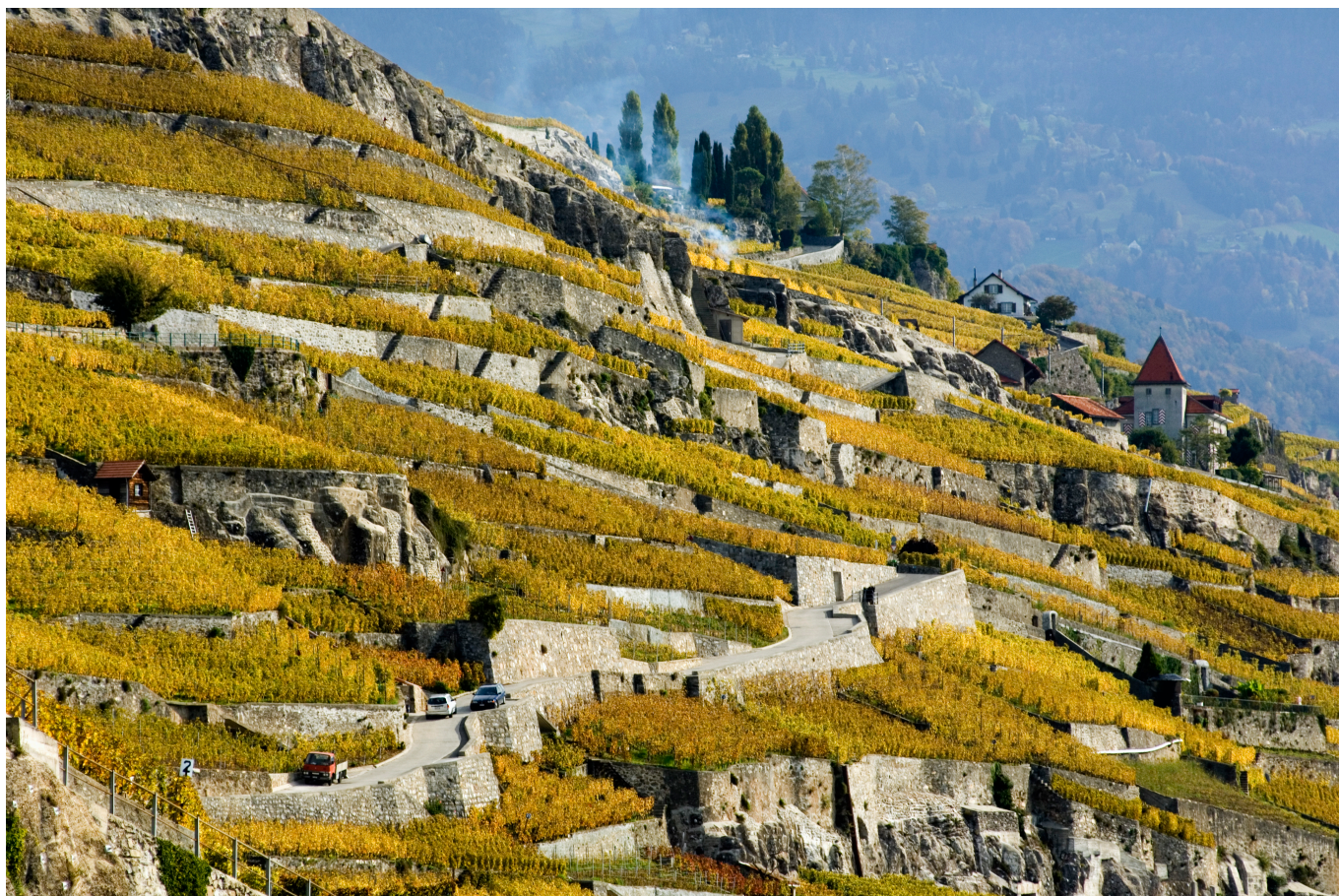
Виноградники Лаво в кантоне Во (© OTV, Siffert, weinweltfoto.ch)

Auteur: Надежда Сикорская, Берн , 31.08.2018.