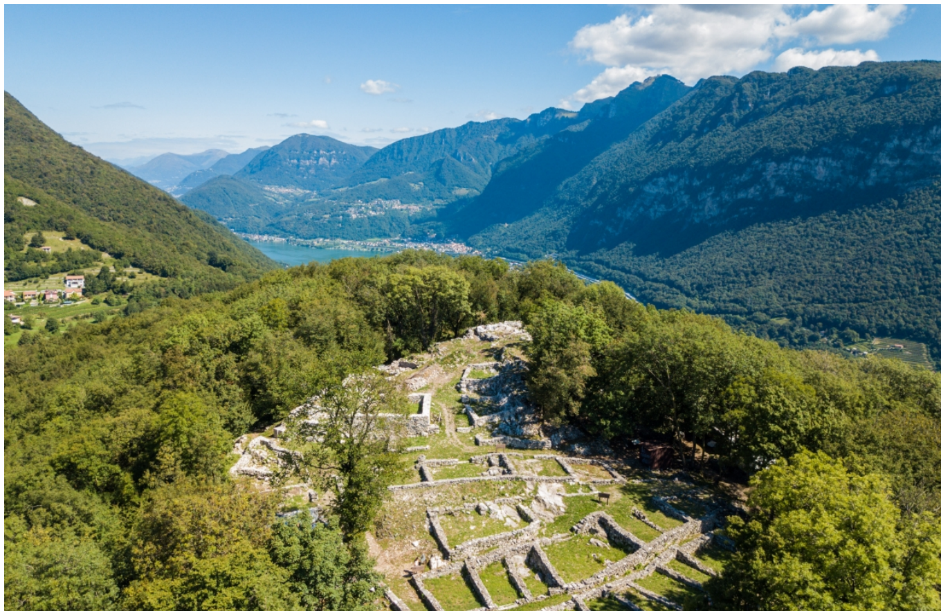
Археологический парк Тремоны, кантон Тичино

Не секрет, что Швейцария славится многочисленными местными особенностями: диалектами, пейзажами, архитектурными стилями, одеждой, музыкой, легендами. Все это – отражение разных образов жизни, традиционных укладов и ремесел. Это культурное наследие прочно вошло в жизнь как общества в целом, так и в жизнь каждой семьи, способствуя формированию национальной идентичности.