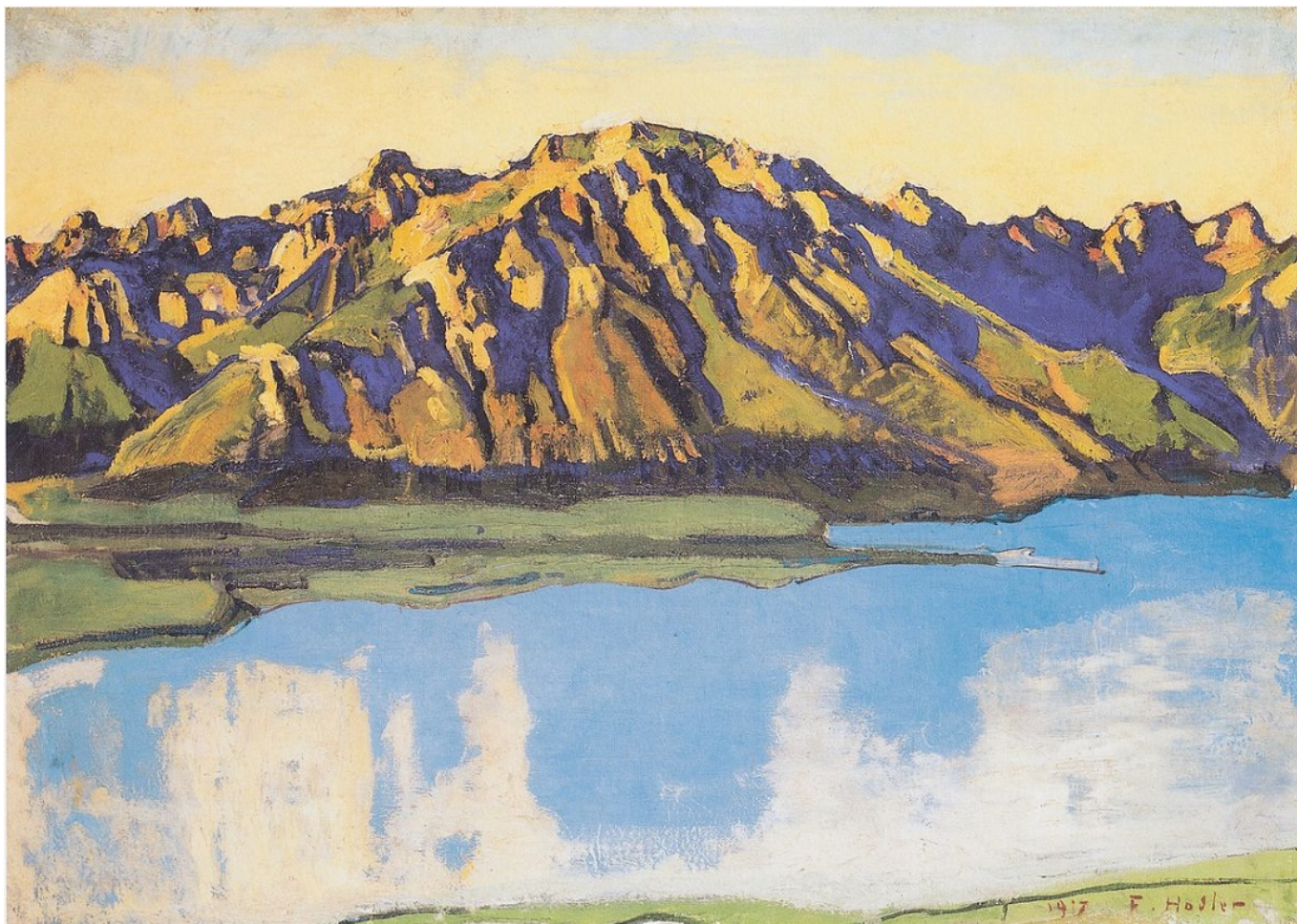
Граммон в лучах утреннего солнца, 1917. Фердинанд Ходлер.

В 1913 году Ходлер переехал в квартиру на втором этаже здания на набережной Монблан, 29 – это предпоследний пункт велопогулки. Престижный адрес говорит о том, что в конце жизни дела у художника пошли в гору, и он стал хорошо зарабатывать. Однако со здоровьем у него начались проблемы. Из-за болезни легких он оставался в своей комнате и писал вид, открывавшийся из его окон. Нужно сказать, что с видом ему повезло: окна выходили на Монблан, Ле-Моль и Женевское озеро. Ходлер писал горный массив при разном освещении и в разное время дня, и теперь у нас есть десятки прекрасных пейзажей с бирюзовым озером и фиолетовыми склонами.