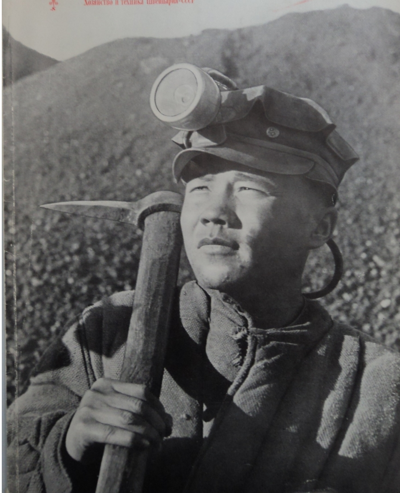
Журнал "Хозяйство и техника Швейцария-СССР", №1, 1948 г.