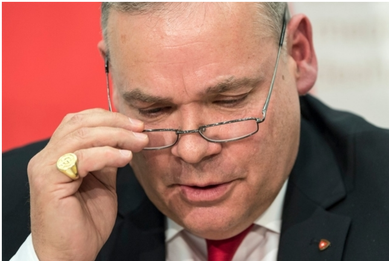
Новый «Джеймс Бонд» Швейцарии