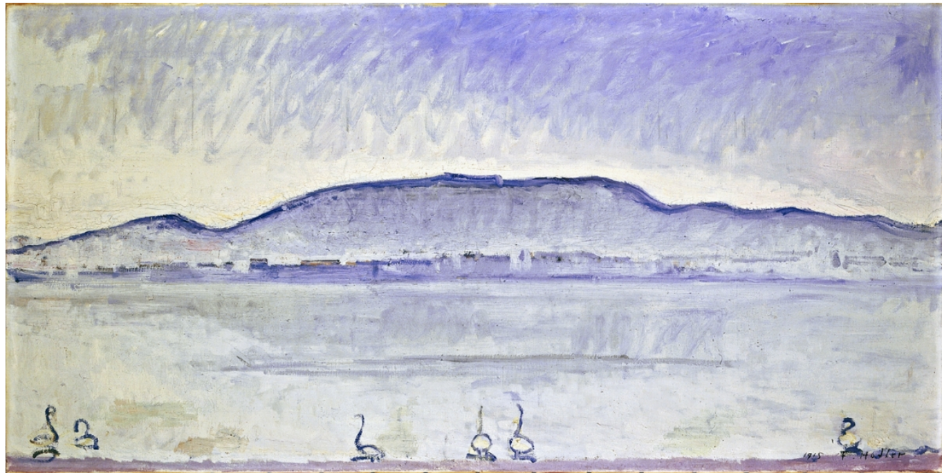
Фердинанд Ходлер (1853-1918) Озеро Леман и Салев с лебедями, 1915 г.

Центральным событием года станет выставка «Ходлер//Параллелизм», которую можно будет увидеть в Музее Рат с 20 апреля по 19 августа 2018 года. Экспозиция, организуемая совместно с Художественным музеем Берна, выводит на первый план практическое воплощение разработанной Ходлером в конце 1890-х годов теории параллелизма, которой соответствует стиль, характеризующийся симметричным/параллельным расположением фигур в танцевальных или ритуальных позах. Ходлер повторял и менял местами человеческие фигуры, цветовые и световые зоны на протяжении многих работ, чтобы придать им большую цельность и выразительность. Цвет и линия становятся в картинах-панно Ходлера главными выразителями определенного эмоционального состояния — экстатического порыва, чувства томления, погруженности в сон. Этот прием, характерный для живописи европейского модерна, Ходлер переносит и в монументальную живопись.