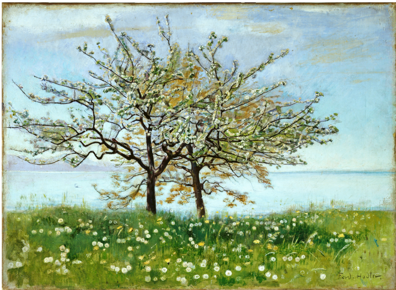
Фердинанд Ходлер (1853-1919). Весенний пейзаж с цветущими деревьями, ок. 1895