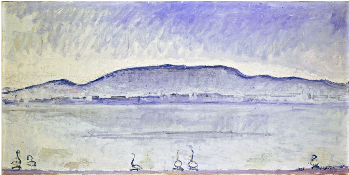
Фердинанд Ходлер (1853-1918) Озеро Леман и Салев с лебедями, 1915 г.

Центральным событием года станет выставка «Ходлер//Параллелизм», которую можно будет увидеть в Музее Рат с 20 апреля по 19 августа 2018 года. Экспозиция, организуемая совместно с Художественным музеем Берна, выводит на первый план практическое воплощение разработанной Ходлером в конце 1890-х годов теории параллелизма, которой соответствует стиль, характеризующийся симметричным/параллельным расположением фигур в танцевальных или ритуальных позах. Ходлер повторял и менял местами человеческие фигуры, цветовые и световые зоны на протяжении многих работ, чтобы придать им большую цельность и выразительность. Цвет и линия становятся в картинах-панно Ходлера главными выразителями определенного эмоционального состояния — экстатического порыва, чувства томления, погруженности в сон. Этот прием, характерный для живописи европейского модерна, Ходлер переносит и в монументальную живопись.