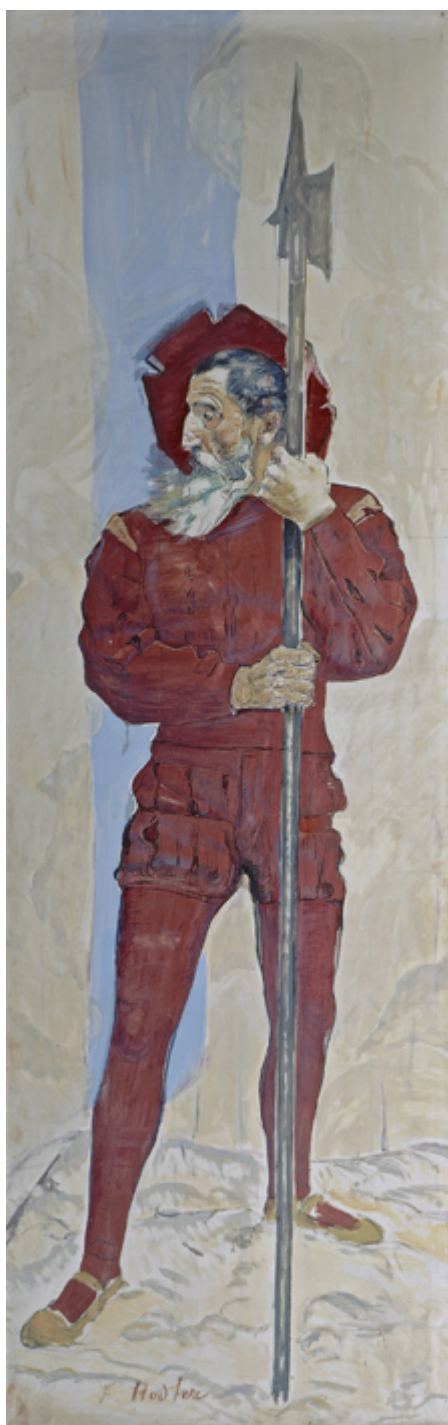
Фердинанд Ходлер (1853-1918) Воин с алебардой, 1895/1896 г.

«Ходлер и швейцарские наемники: от мифа к реальности» - вот в таком неожиданном ракурсе предстанет художник в постоянных залах Музея искусства и истории. О том, что швейцарцы нанимались на службу в иностранные армии со Средневековья до современности, всем известно, Наша Газета тоже об этом писала . Фердинанд Ходлер предложил несколько трактовок этой страницы истории, которую сам он считал героической - его видение отразилось в огромных панно, украшавших Дворец искусств во время Национальной выставки 1896 года и в оформлении оружейного зала Национального музея в Цюрихе. Три из этих произведений будут представлены в зале музея, где обычно выставлены разнообразные доспехи, неизменно вызывающие восторг у мальчишек. (с 28 сентября по 30 декабря.)