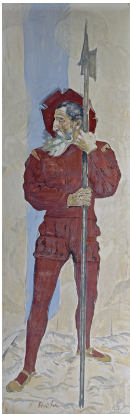
Фердинанд Ходлер (1853-1918) Воин с алебардой, 1895/1896 г.

«Ходлер и швейцарские наемники: от мифа к реальности» - вот в таком неожиданном ракурсе предстанет художник в постоянных залах Музея искусства и истории. О том, что швейцарцы нанимались на службу в иностранные армии со Средневековья до современности, всем известно, Наша Газета тоже об этом писала . Фердинанд Ходлер предложил несколько трактовок этой страницы истории, которую сам он считал героической - его видение отразилось в огромных панно, украшавших Дворец искусств во время Национальной выставки 1896 года и в оформлении оружейного зала Национального музея в Цюрихе. Три из этих произведений будут представлены в зале музея, где обычно выставлены разнообразные доспехи, неизменно вызывающие восторг у мальчишек. (с 28 сентября по 30 декабря.)