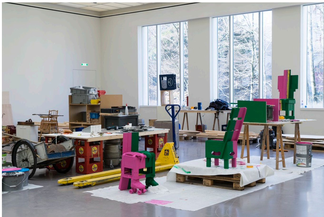
Процесс работы над инсталляцией Autorreconstrucción: Social Tissue.

После успеха в Лондоне художника стали приглашать музеи из США, Франции и Германии, а сегодня его персональная выставка открывается в Цюрихе. Новый проект тоже обещает быть грандиозным: на пять недель 1 000 квадратных метров выставочного пространства превратятся в мастерскую, в которой прямо на глазах посетителей Крузвиллегас будет создавать новые работы. Выставка приобретет законченный вид только в самом конце, когда все завершённые инсталляции будут представлены вместе. Входной билет дает право на три посещения и позволит проследить, как менялась экспозиция.