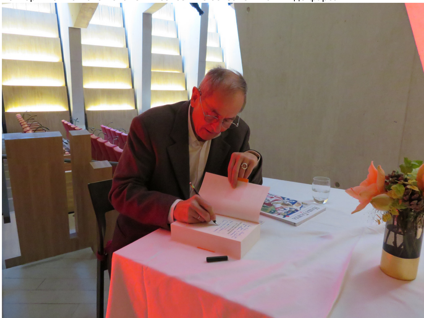
Тьерри Уолтон подписывает дарственные надписи

Интересно, что о политической слепоте говорил совсем недавно французский журналист, писатель и философ Бернар-Анри Леви, которому в 2015 году был запрещен въезд в Россию. И вспоминал Уолтона. «Слепота, которую демонстрируют представители «партии Путина» – от Марин Ле Пен во Франции и Найджела Фараджа в Великобритании до Герта Вилдерса в Нидерландах, – конечно, имеет исторические прецеденты, – писал он. – Происходящее сегодня заставило меня читать книги Тьерри Уолтона об истории коммунизма и добровольных уступках ему, которые он провоцировал на протяжении десятилетий. Удивительно, до какой степени (цитируя Жан-Франсуа Ревеля) знание о прошлом может оказываться трагически невостребованным, и как одни и те же ошибки, то же добровольное незнание, могут повторяться на новом этапе – и совсем не обязательно в виде фарса.»