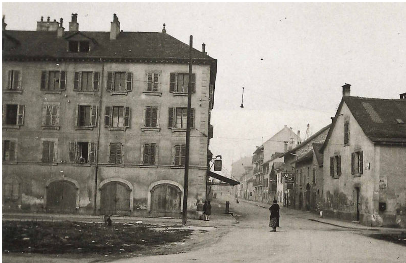
Город Каруж (из личной коллекции Н. Бегловой)

Auteur: Наталья Беглова , Женева , 05.12.2017.