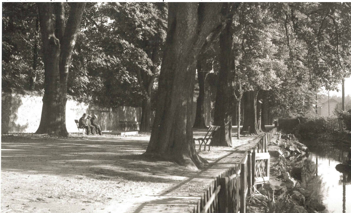
Каружский канал