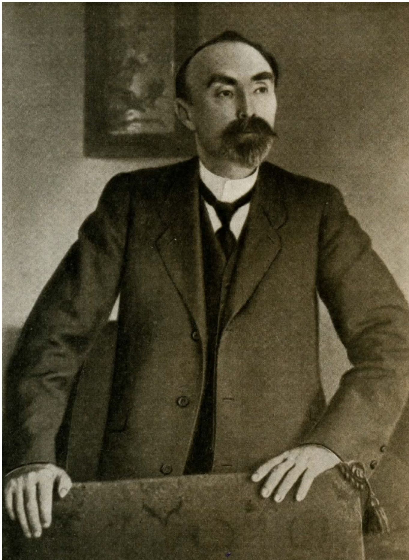
Г. В. Плеханов (1856-1918)

В обширном полицейском докладе от 30 ноября 1903 года перечислялись