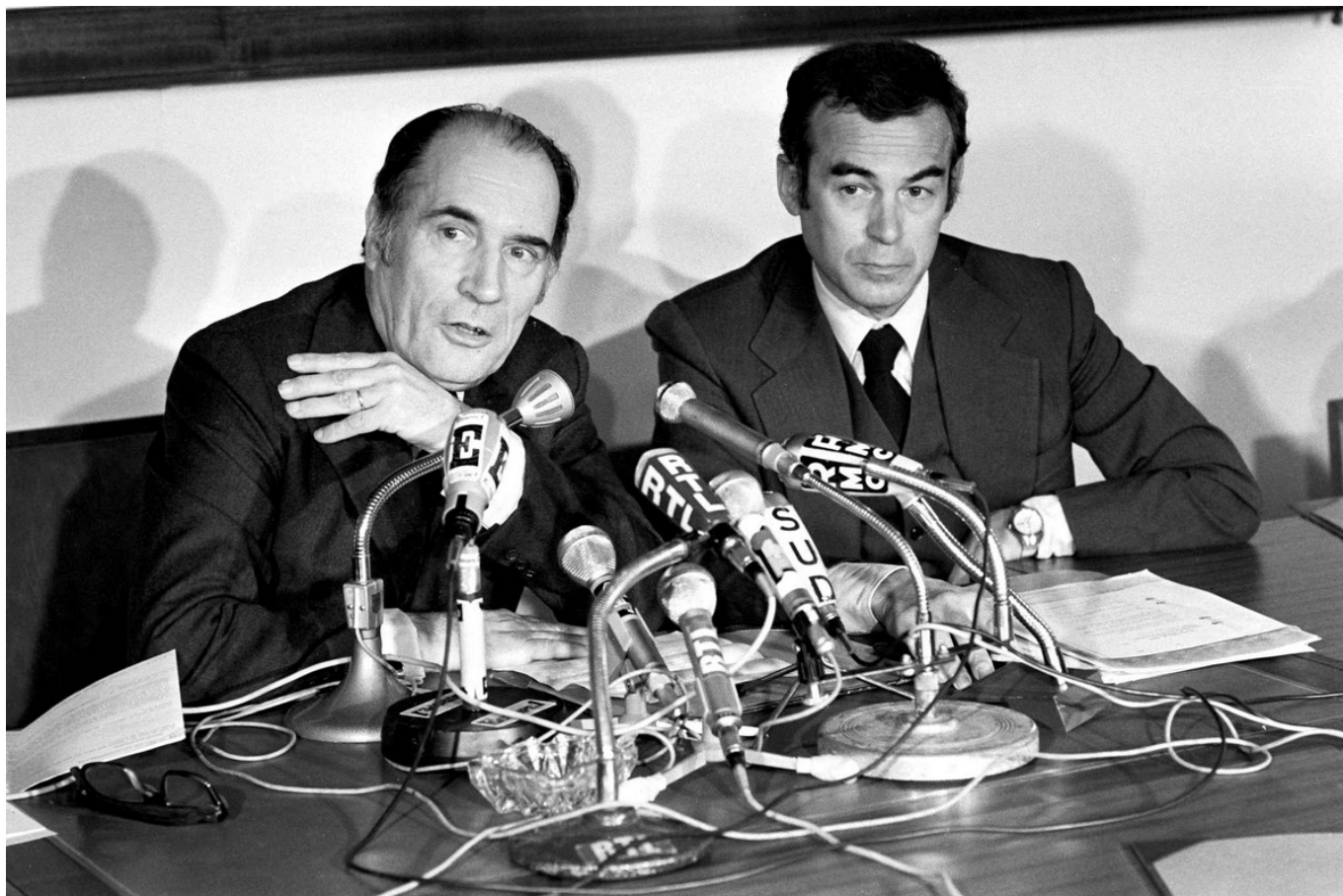
Президент Франсуа Миттеран и Робер Бадентер, 1981 г.