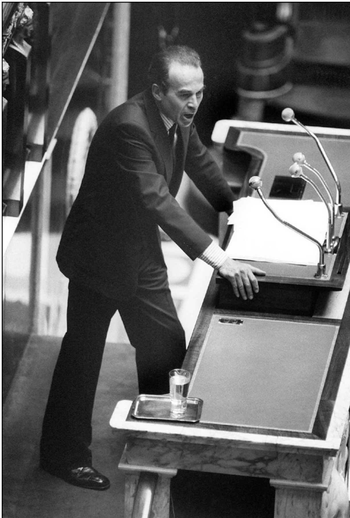
Министр юстиции Робер Бадентер на трибуне Национальной Ассамблеи. Париж, 17 сентября 1981 г.

Мне кажется, проблематика отмены смертной казни не связана с «ситуацией». Терроризм во Франции существовал до ее отмены в 1981 году и существует сегодня.