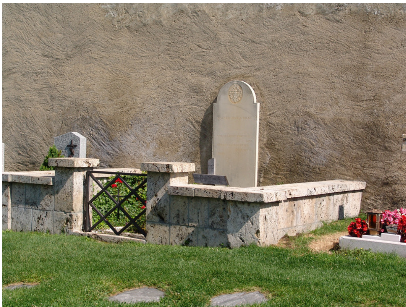
Могила Рильке у церкви св. Михаила над Рароном

Auteur: Анастасия Александрова , Цюрих-Берн , 18.09.2017.