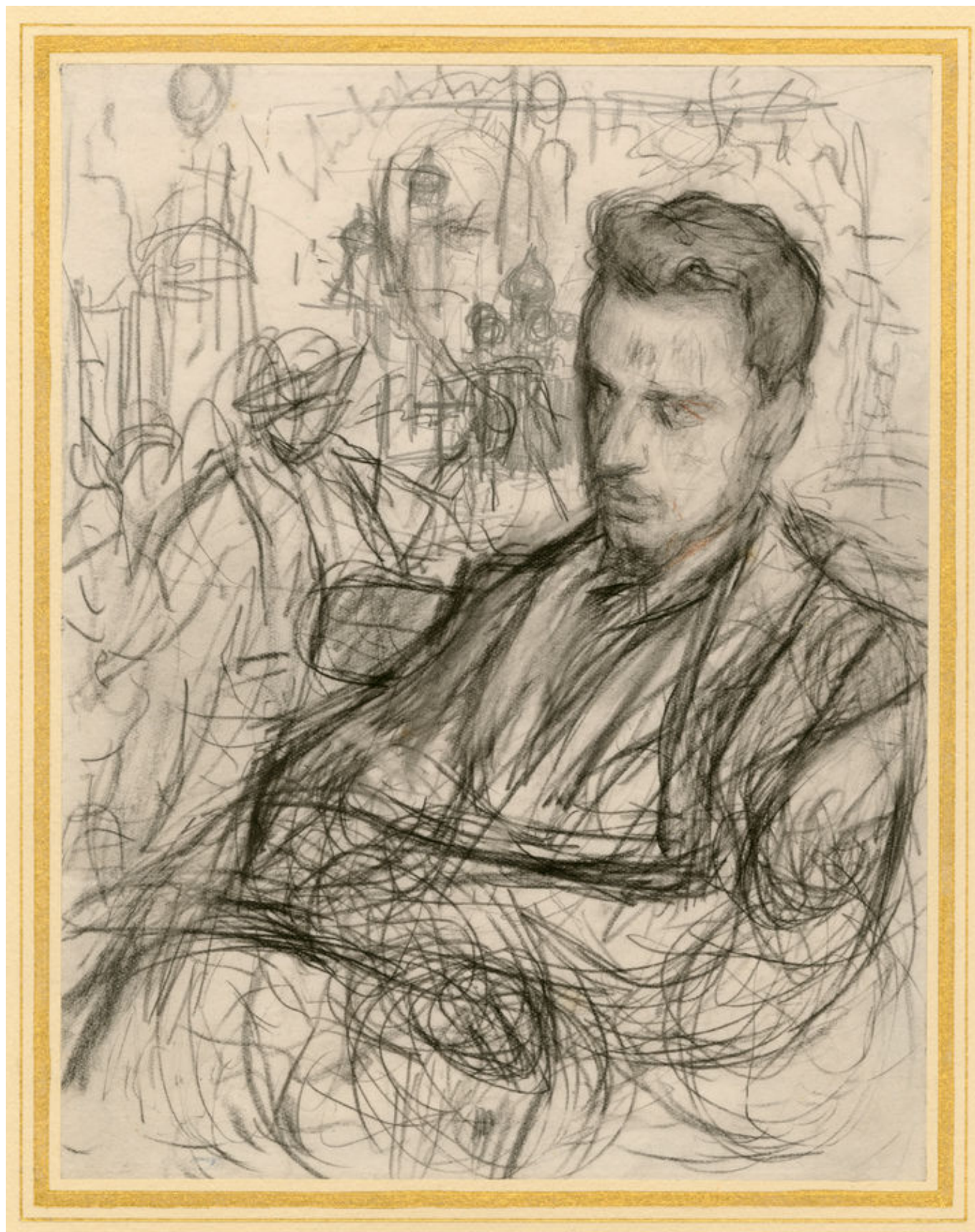
Леонид Пастернак. Эскиз к портрету Райнера Марии Рильке

Первая встреча Рильке с Россией, ставшая для него подлинным духовным потрясением, произошла в 1899 году. «Тогдашняя Москва с её бесчисленными монастырями, башнями и златоглавыми церквами, с её высящимся над городом бело-