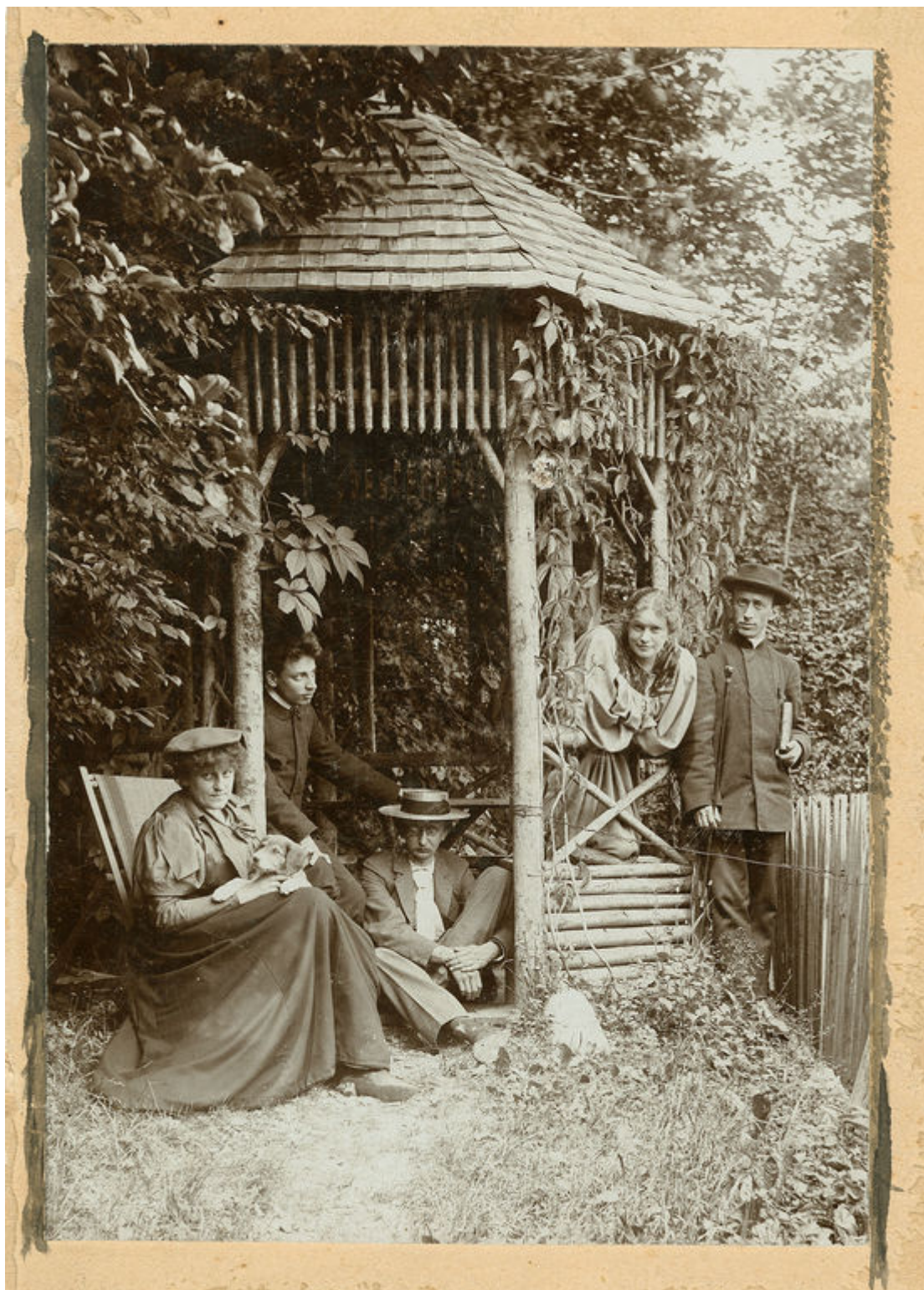
Фрида фон Бюлов, Райнер Мария Рильке, Август Эндель, Лу Андреас-Саломе, Аким Волинский в Вольфратсхаузене, 1897 г.

Ощувив глибоке духовне родство з руською культурою, сразу ж після повернення додому Рильке взявся за вивчення російської мови. Поет вивчав твори з історії Росії, читав книги російських авторів. Осенью 1899 року він написав кілька новел з циклу «Історії про Господа Бога», в яких відбилися не тільки враження від першої поїздки по Росії, але й від того, що він пізніше дізнався.