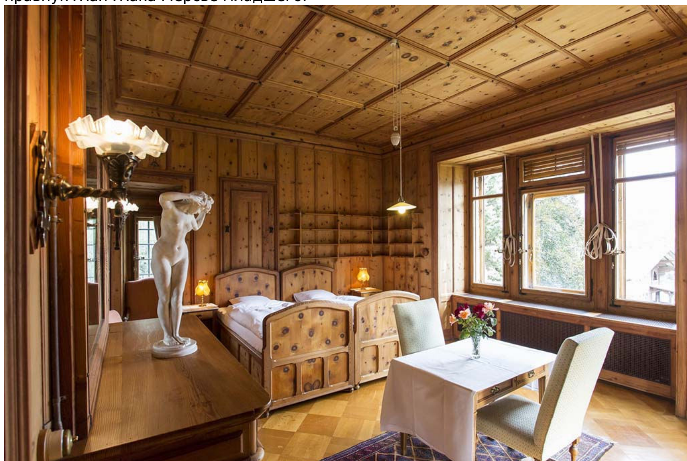
Интерьер спальни, стены и потолок – горная сосна