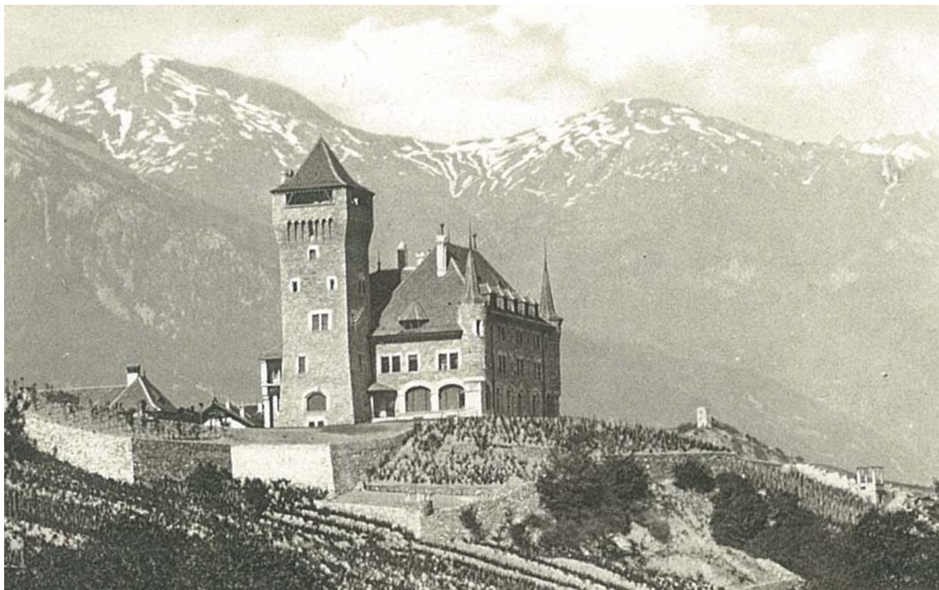
Дух времени