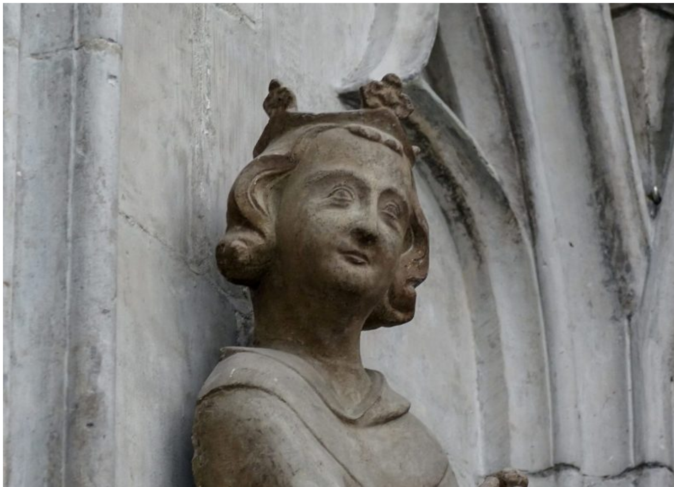
Один из волхвов, пришедших поклониться Младенцу Христу

В 2010 году власти кантона Во предприняли масштабные реставрационные работы, которые продлились несколько лет и обошлись в двадцать миллионов франков. Портал южных ворот реставрировали на протяжении последних сорока лет: чудо архитектурного гения Средневековья, выполненное в 1220-1230-х годах, предстало перед лозанцами в прежнем блеске. Именно через этот портал заходили в древности верующие в собор, тогда как в других католических церквях главный вход был устроен в западном портале. Сегодня посетители могут увидеть скульптуры святых, о которых повествуется в Ветхом и Новом Заветах, сцены Успения Пресвятой Девы, Христа во Славе.