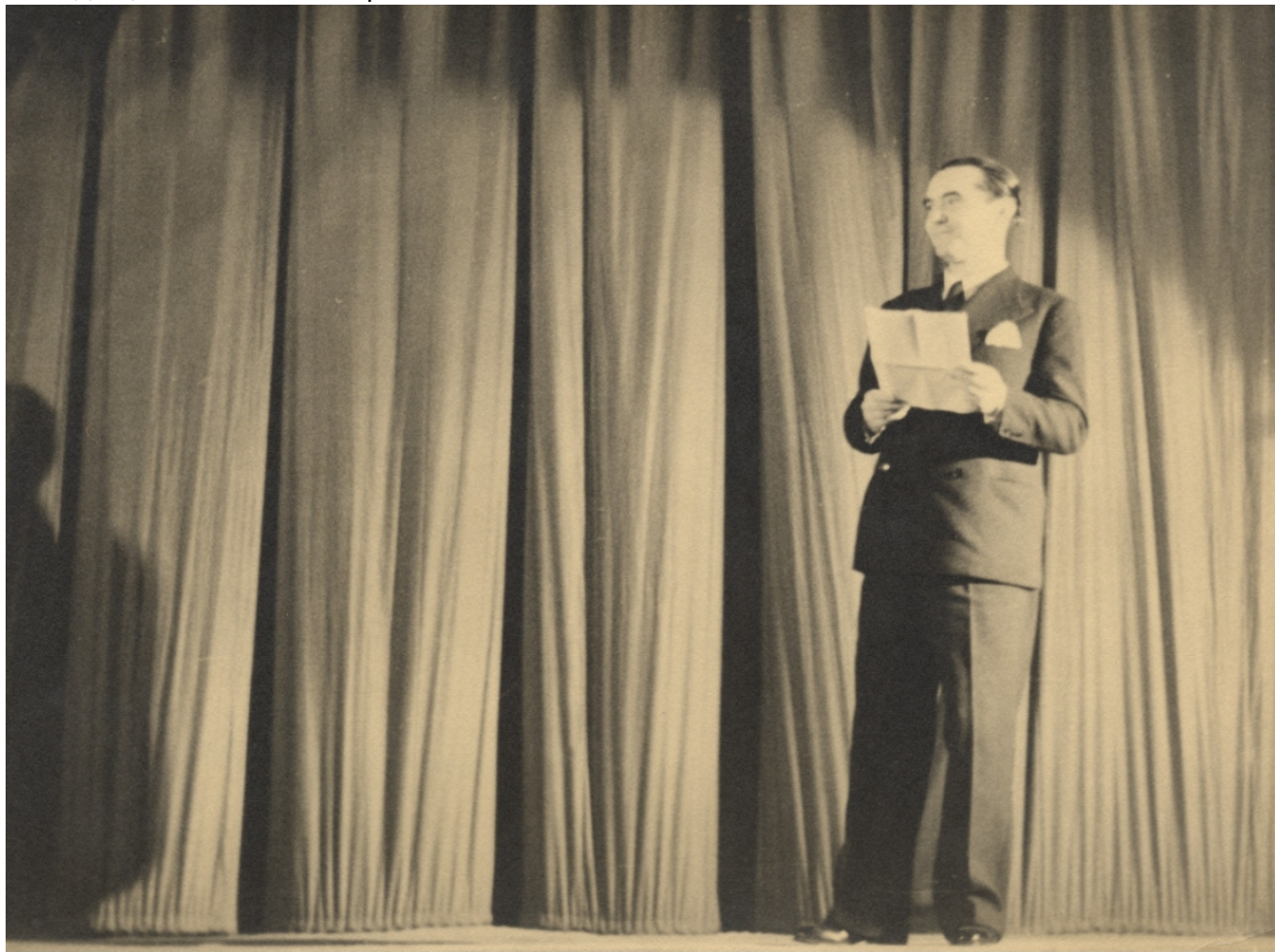
Федерико Гарсиа Лорка на спектакле по пьесе Лопе де Вега «Дурочка» в Театре Барселоны, 10 сентября 1935 г.

Выставка, открывающаяся завтра в Библиотеке Фонда Яна Михальского, регулярно радующего нас интересными и познавательными проектами, ограничена театральной составляющей творчества Федерико Гарсиа Лорки, для которого характерны пять ключевых тем: любовь, отчаянный поиск любви и разочарование как неизбежное его следствие; одиночество, в которое погружаются его персонажи; маска, как ханжеская защита; театр, как большая метафора лжи; и, наконец, смерть, находящаяся в вечном противостоянии с жизнью.