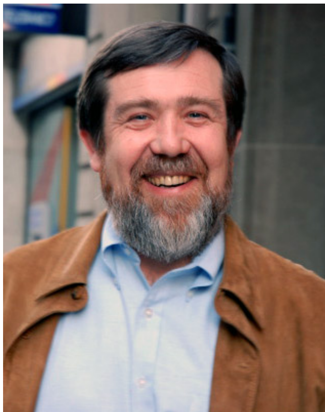
Алексей Пажитнов – создатель игры «Тетрис»