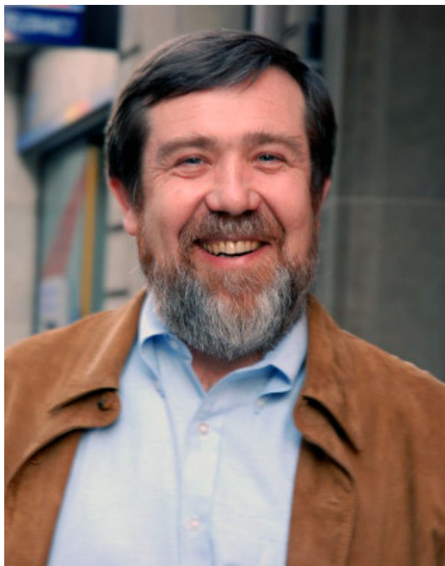
Алексей Пажитнов – создатель игры «Тетрис»