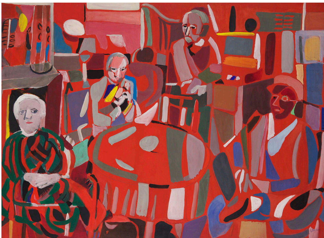
Андрей Ланской (1902-1976). "Без названия", около 1930 г. Гуашь, бумага, 73 x 100 см