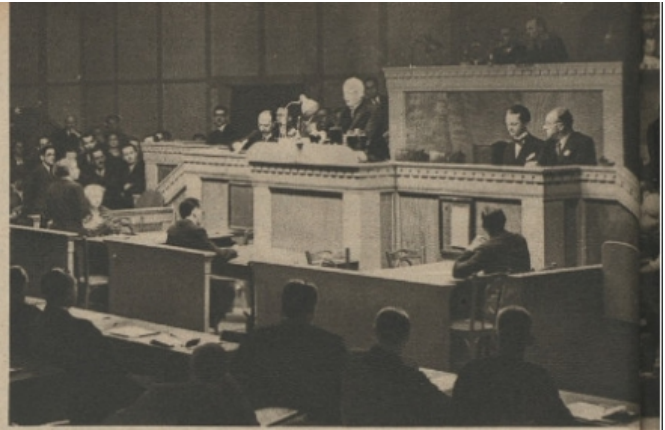
1934 Du haut de la tribune de la Société des Nations, M. Motta, chef du Département politique fédéral, s'oppose au nom de la Suisse à l'admission de l'U. R. S. S. au sein de l'institution de Genève.