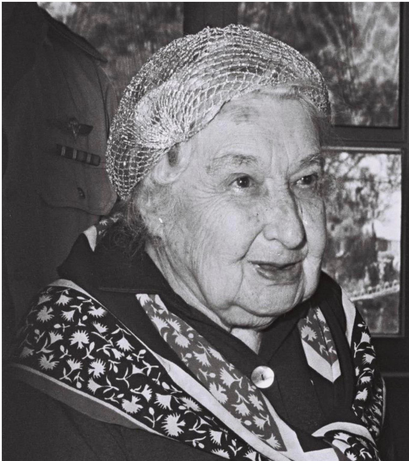
Анжелика Балабанова в 1962 году, в Израиле

Катастрофа надвигается стремительно. Спасая остатки движения, социалисты проводят встречу в Лугано. Она даст импульс новому движению – Циммервальдскому, столетие которого Наша Газета «отмечала» вместе с ее читателям, но о котором стоит напомнить, ведь с этого момента начинается особая, драматическая полоса и в личной истории Анжелики Балабановой, и в истории международного левого движения.