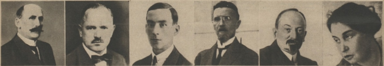
M. Calonder était à la tête du Département politique fédéral lorsque le Conseil fédéral confia la mission Bersine, coupable d'avoir trépidé dans la grève générale de 1918.

Toutefois, ce chemin était parsemé d'obstacles. A chaque fois que s'esquissait un rapprochement, des événements survenaient et se mettaient à la traverse, de telle sorte que l'on avait de part et d'autre des griefs à faire valoir. Notre peuple a toujours éprouvé une