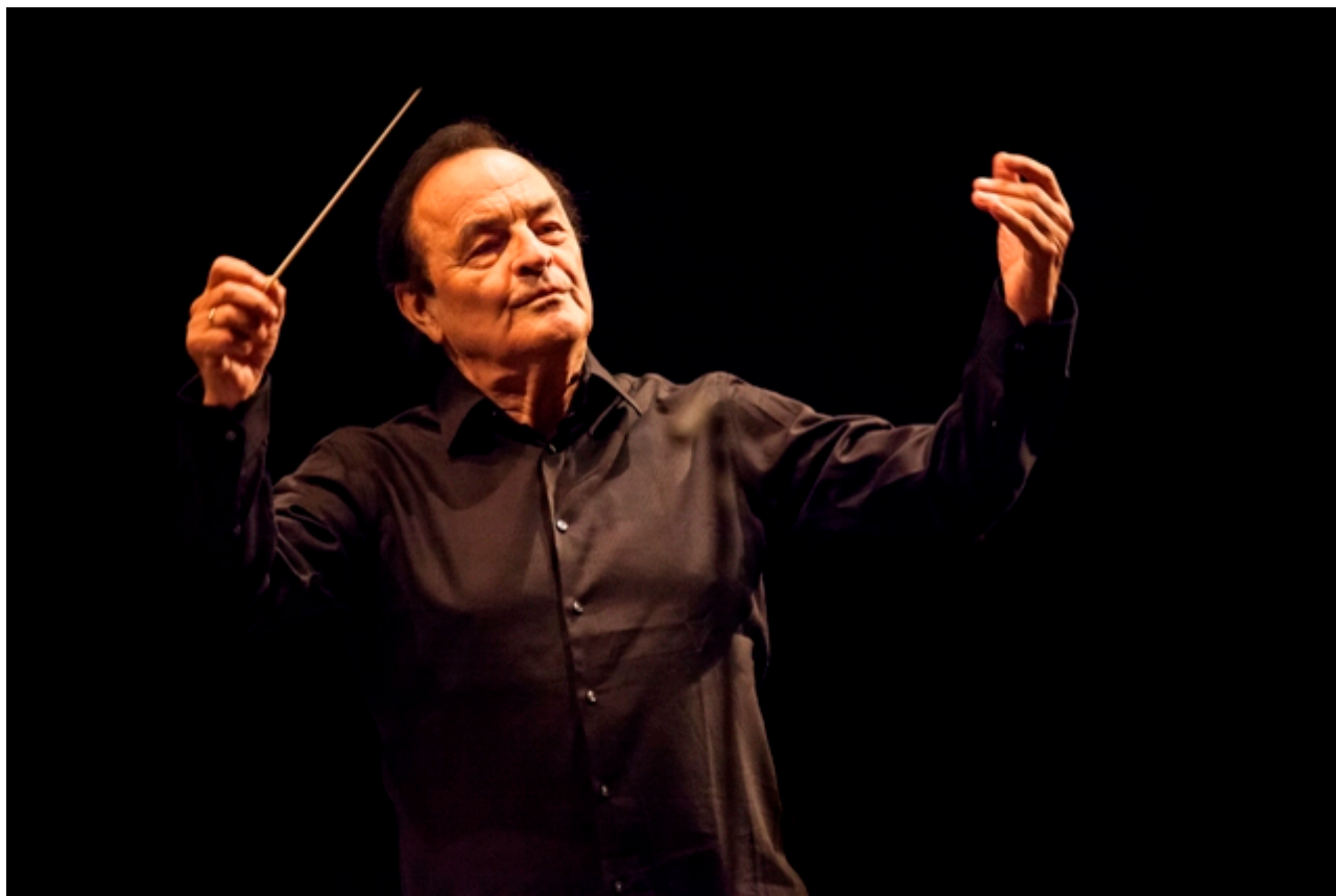
Маэстро Шарль Дютуа