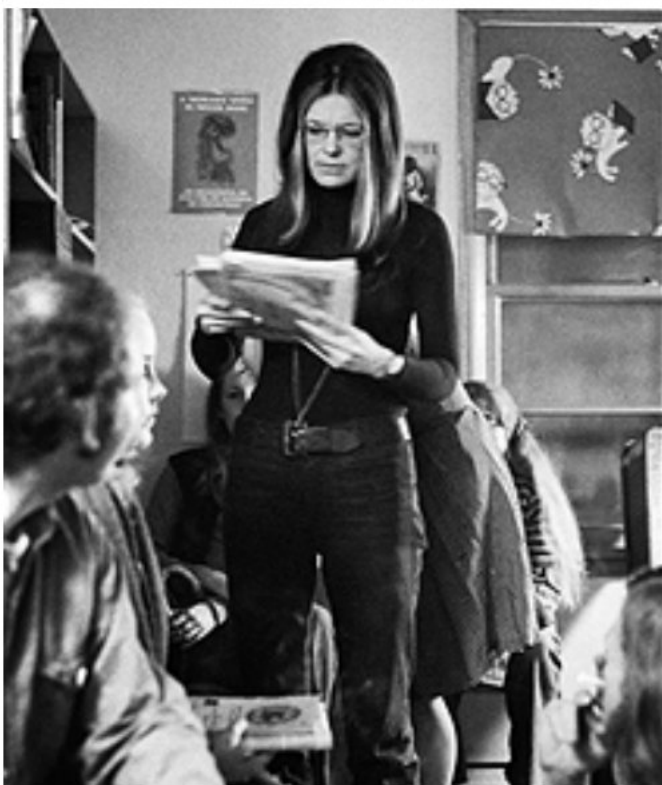
Глория Стайнем выглядит современно в каждом десятилетии