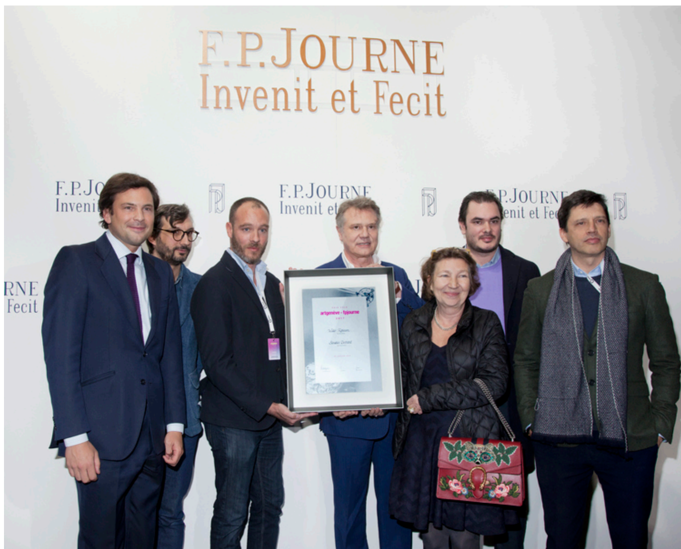
Ф. П. Журн и члены жюри с новым лауреатом

Auteur: Надежда Сикорская, Женева , 27.01.2017.