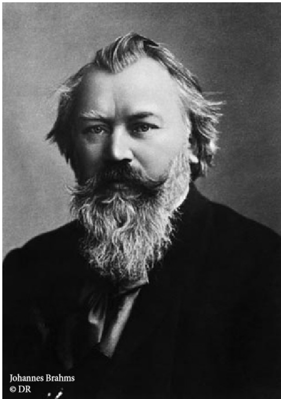
Иоганнес Брамс (1833-1897)

В 2009 году, блестяще дебютировав с Национальным молодежным оркестром Великобритании, он стал главным дирижером коллектива и оставался на этом посту до 2013 года. С Ливерпульским филармоническим и Национальным молодежным оркестром Великобритании дирижер неоднократно участвовал в фестивале BBC Proms. С сезона 2013/14 Петренко занимает должность главного дирижера Филармонического оркестра Осло (Норвегия).