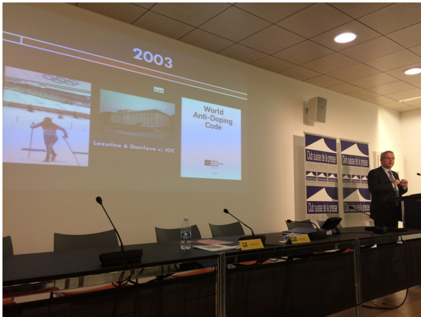
История CAS

ФИФА стала последней международной федерацией, признавшей юрисдикцию Спортивного арбитражного суда в Лозанне. Это произошло в 2002 году, и с тех пор CAS приходится разбирать по 100-250 «футбольных» дел ежегодно. По иронии судьбы последнее – и, пожалуй, самое громкое – касается бывшего президента ФИФА Зеппа Блаттера, отстраненного на 6 лет от профессиональной деятельности в связи с разразившимся в прошлом году коррупционным скандалом . В начале декабря CAS подтвердил это решение и оставил в силе штраф в размере 50 тысяч франков, который предстоит заплатить Блаттеру. Бывший президент ФИФА согласился с вынесенным вердиктом и отказался от дальнейших судебных разбирательств.