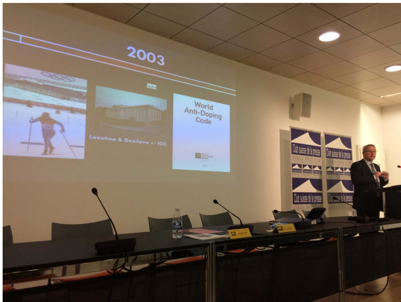
История CAS