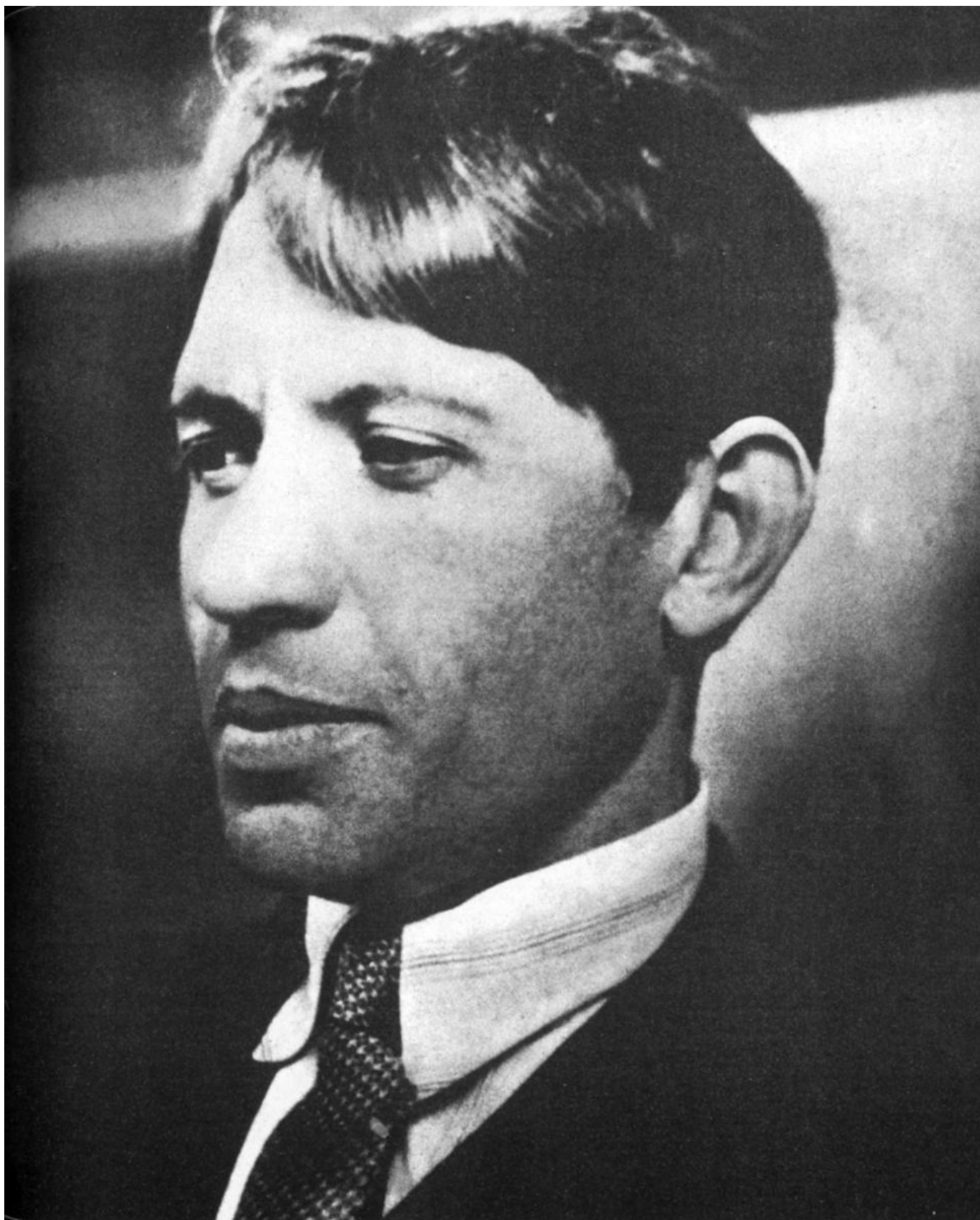
Художник Хаим Сутин (1893-1943)

Ральф Дутли сумел написать роман, как картину. Преобладающие цвета в ней – черный (цвет погромов, катафалка, фашистских униформ, ночи, язвы, голода) и белый (цвет молока, рая, любимых женщин, передышек от боли и безболезненного будущего), с то и дело врывающимися яркими красками французских пейзажей, дошедших до нас в неподражаемой сутинской манере. При этом цвет раздражает