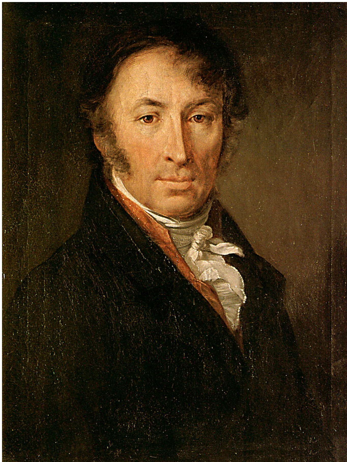
В.А. Тропинин. Портрет Н. М. Карамзина. 1818 г.