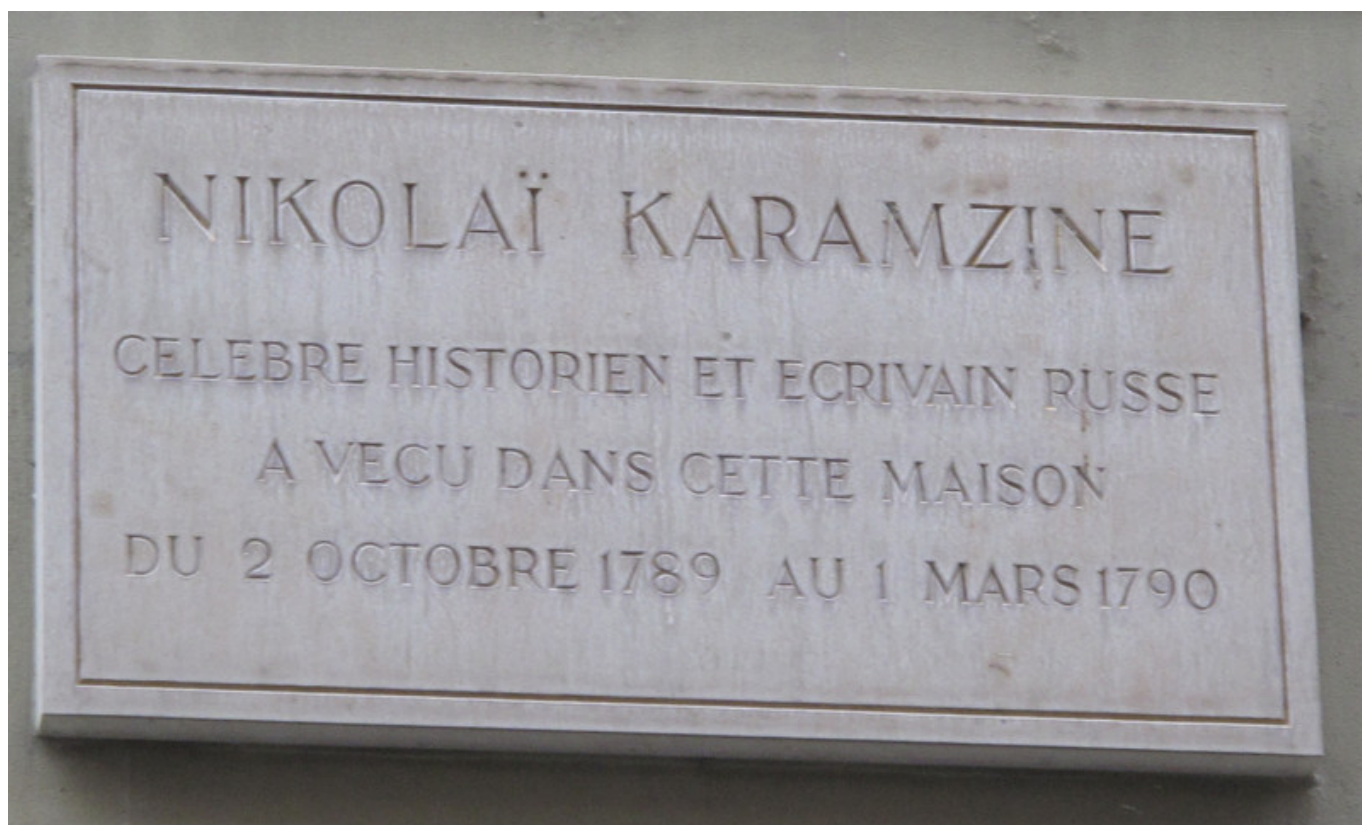
Мумориальная доска в память о Н.М. Карамзине на доме № 14 на Grand-Rue Женевы

О Французской революции он услышал впервые во Франкфурте-на-Майне; известие это его чрезвычайно взволновало. Въехав в Эльзас, он увидел там сплошное смятение: «целые деревни вооружаются, и поселяне пришивают кокарды к шляпам. Почтмейстеры, постиллионы, бабы говорят о революции». В Страсбурге взбунтовался здешний гарнизон: «солдаты не слушаются офицеров, пьют в трактирах даром, бегают с шумом по улицам, ругают своих начальников и проч.». Решительно не принимая анархии и революционного насилия, путешественник спешит в Швейцарию, «чтобы там вдохнуть воздух мирной свободы».