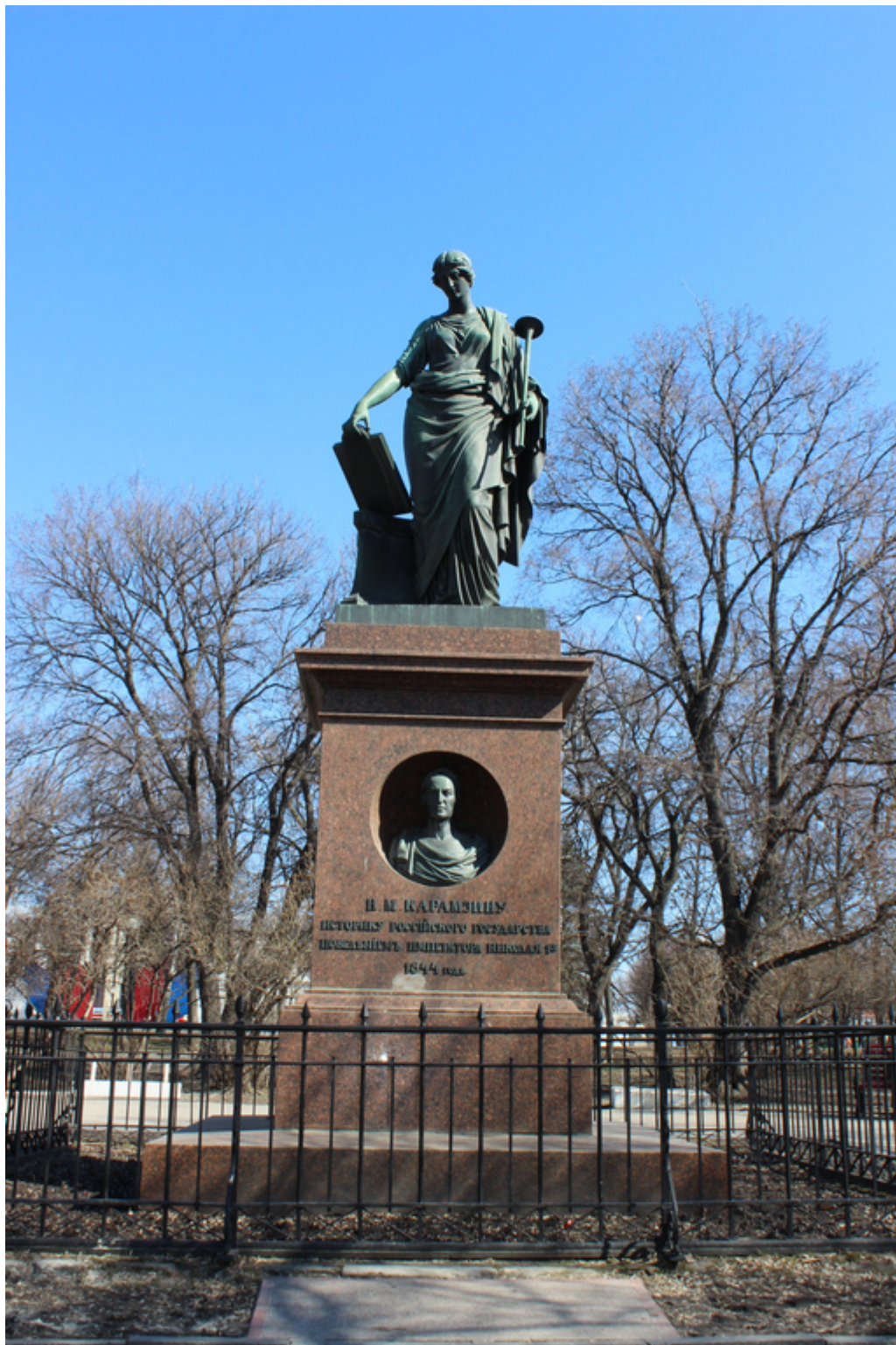
Памятник Н. М. Карамзину в Ульяновске

Одним словом, друзья мои, путешествие питательно для духа и сердца нашего. Путешествуй, ипохондрик, чтобы исцелиться от своей ипохондрии! Путешествуй, мизантроп, чтобы полюбить человечество! Путешествуй, кто только может!».