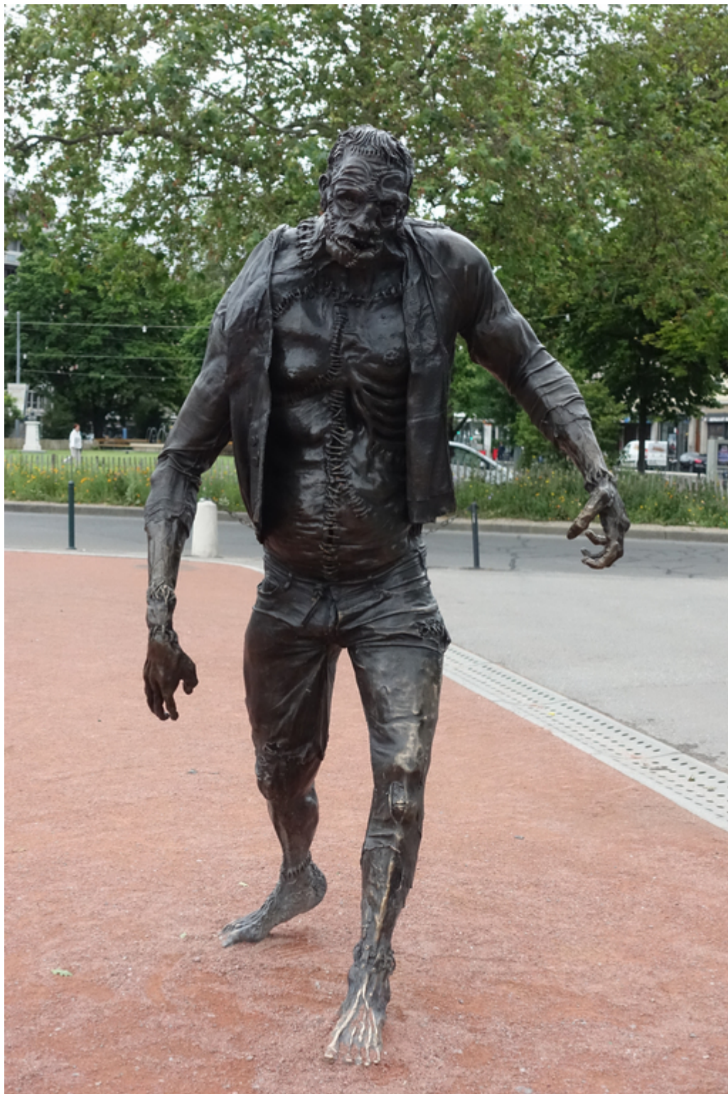
На женеvской площади Пленпале Франкенштейну становлен памятник

По мнению специалистов, сила Мэри Шелли и Джона Полидори была в том, что они создали своих «героев», порвав со «страшилками» прошлого. Их персонажи – плоды XIX века, начинавшегося, еще оправляясь от шока революционного террора во Франции, травмированного пятнадцатью годами наполеоновских войн, взволнованного изменениями, связанными с развитием промышленности и науки, дестабилизированного социальными трансформациями, в частности, эволюцией роли мужчин и женщин в обществе, и не находившего более в религии ответов на все вопросы и сомнения.