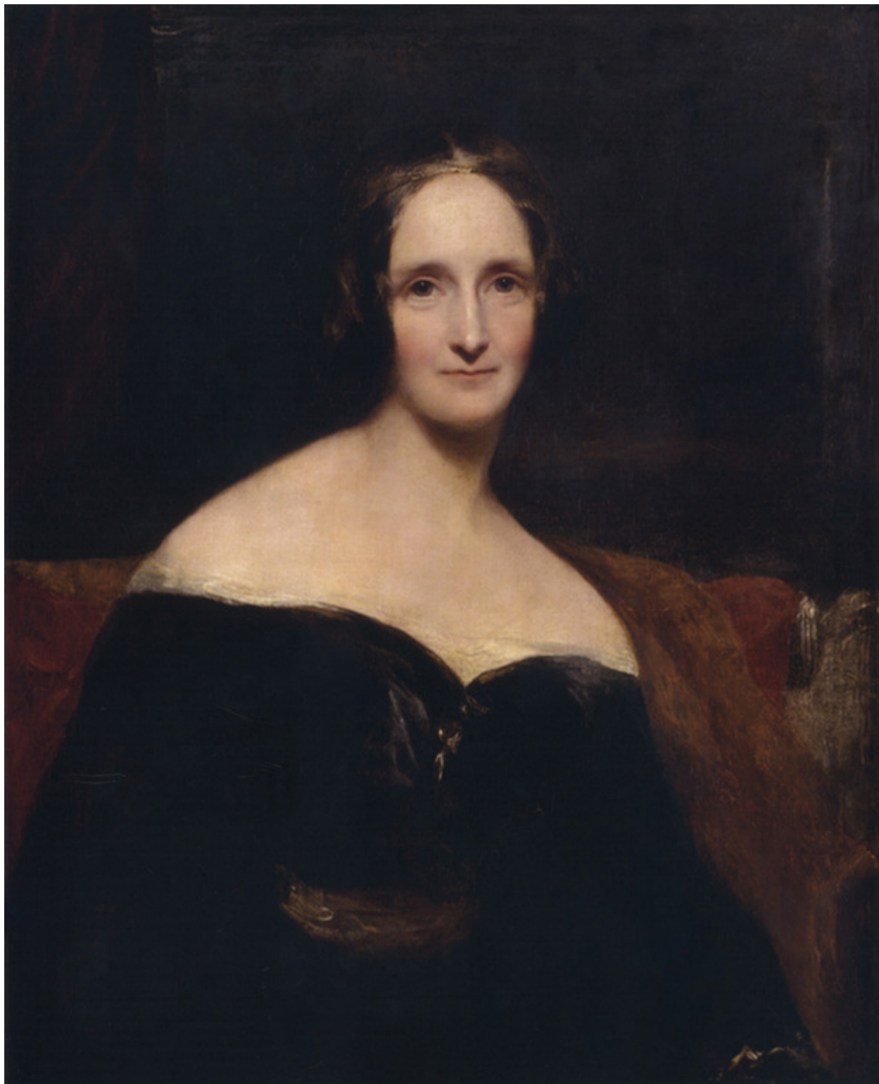
Ричард Ротуэлл (Ирландия, 1800-1868). Мэри Уолстонкрафт Шелли, 1840. Масло, холст, 73,7x61 см (National Portrait Gallery, London)