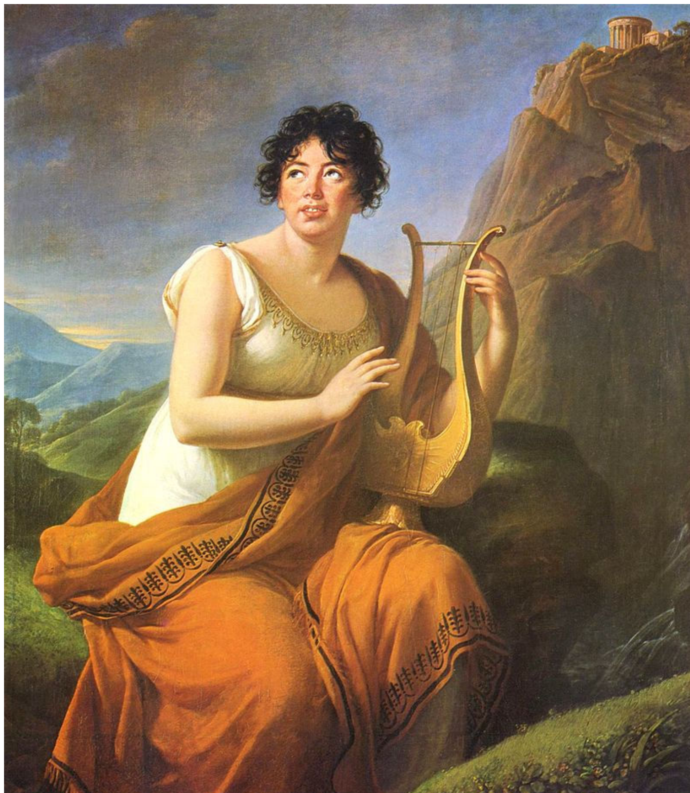
Элизабет Виже-Лебрён. Мадам де Сталь в образе Коринны