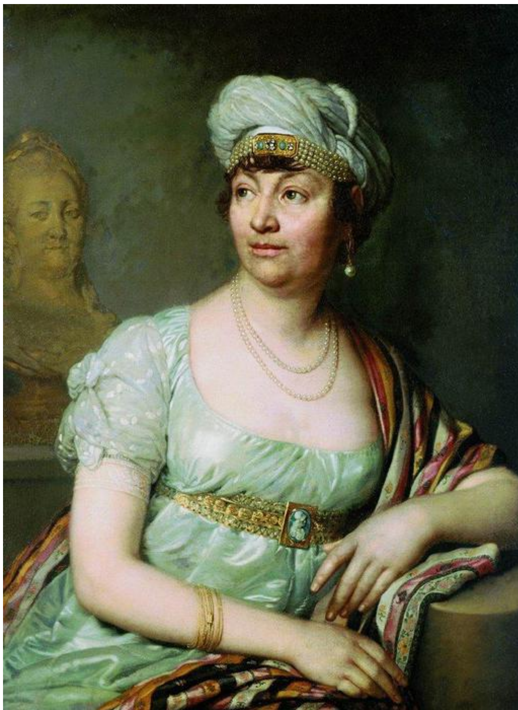
В. Л. Боровиковский. Портрет Анны Луизы Жермены де Сталь. 1812.

Когда Жермена впервые влюбилась, ей было семнадцать, но выбор дочери не устроил мадам Неккер: она желала ей лучшей партии из всех возможных и выбрала, в конце концов, шведского посланника в Париже, барона с железным именем Эрих Магнус Сталь фон Гольштейн. Пока обсуждали подробности и нюансы этой свадьбы, прошло несколько лет, так что на момент венчания невесте исполнилось двадцать. Жениха своего Жермена не любила, но покорилась воле родителей. Брак быстро разочаровал её – барон был в два раза старше, не обладал выдающимся интеллектом, да к тому же интересовался скорее деньгами Неккеров, нежели персоной юной Жермены. Единственное ценное приобретение, которое Жермена вынесла из этого альянса – своё новое имя, так грозно и торжественно звучащее по-русски. Баронесса де Сталь или мадам де Сталь – та знаменитая французская