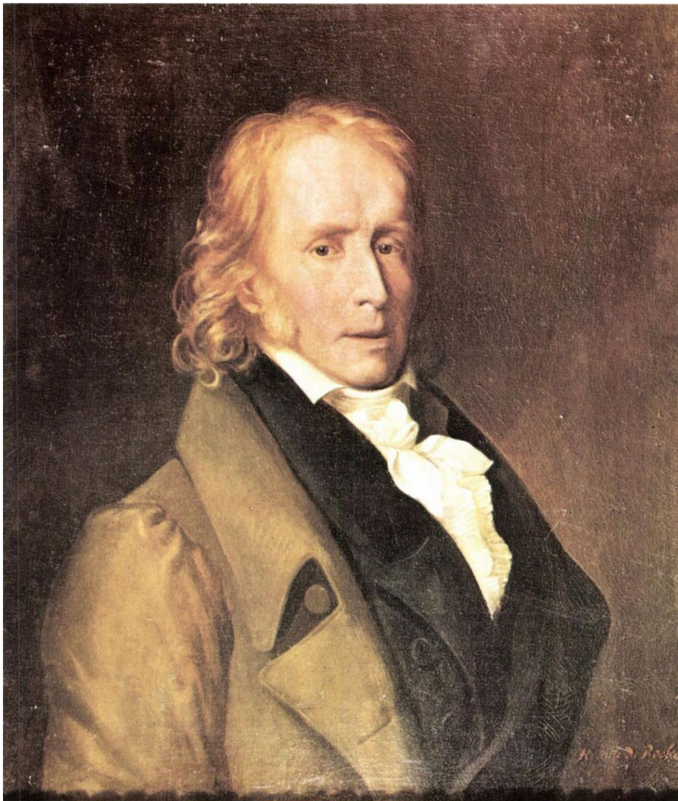
Эркуль де Рош. Портрет Бенжамена Констан (Musée Carnavalet)

В Европе наступали трудные времена, все жили ожиданием перемен. Но какими бы ни были настроения общества, молодой человек всегда остаётся прежде всего молодым человеком, пусть ему и выпало «посетить сей мир в его минуты роковые». Общественная жизнь не отменяет личной, и наоборот. Первые революционные годы Констан проводит в Брауншвейге, здесь он женится на Минне фон Грамм – и разводится с ней раньше, чем привык считаться женатым. Вообще, в женщинах у Констан недостатка не имелось никогда – так, наверное, и полагается автору