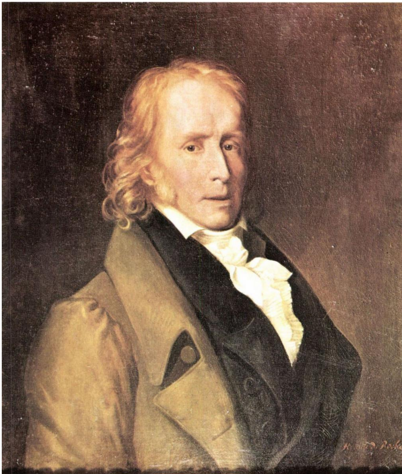
Эркуюль де Рош. Портрет Бенжамена Констан (Musée Carnavalet)