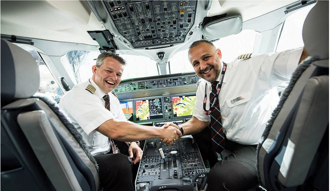
Довольные пилоты SWISS