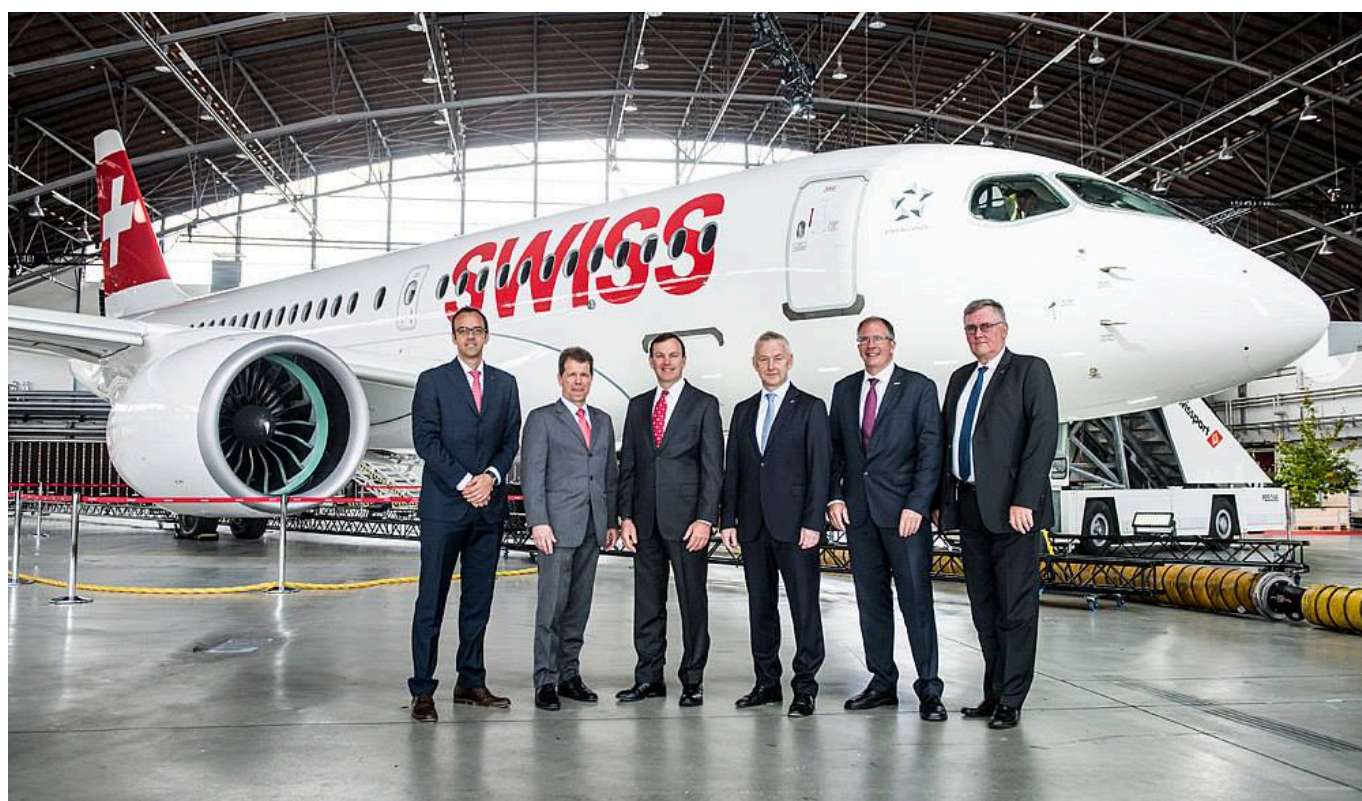
Руководство SWISS и Bombardier на торжественной церемонии в Цюрихе 6 июля 2016 г.