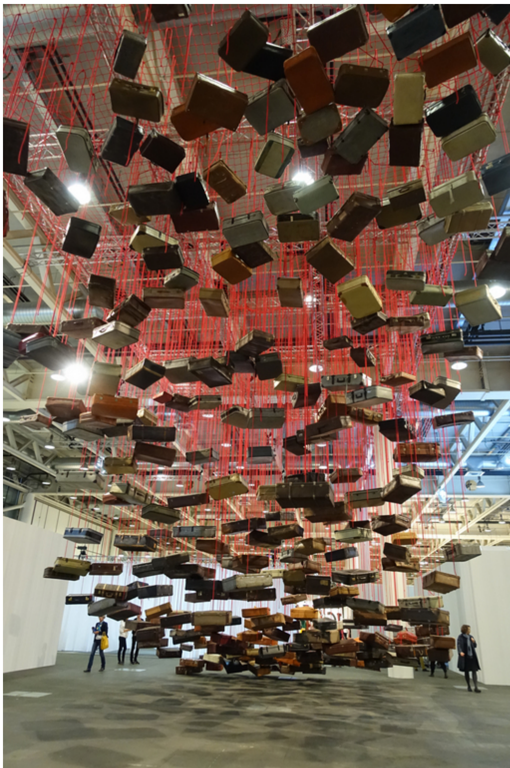
Тихару Сиота "В поисках направления"

Некоторые экспонаты выставки затруднительно отнести к какому-то определенному жанру, так как они находятся на грани инсталляции и перформанса. Вот, например, творение Лауры Лимы из Бразилии под названием «Лифт». Почему название именно такое, мы, признаемся, не поняли, но попробуем описать своими словами это действие в трех частях, триптих. Акт 1: из-под стены высовывается рука со связкой ключей и отбрасывает их от себя метра на полтора. Акт 2: вокруг ключей собираются зеваки и ждут, что произойдет дальше. А дальше не происходит ничего, пока (Акт 3) какая-нибудь сердобольная дама не наклонится и не вложит ключи в протянутую руку. И так в течение целого дня. По мнению кураторов выставки, «сила работы