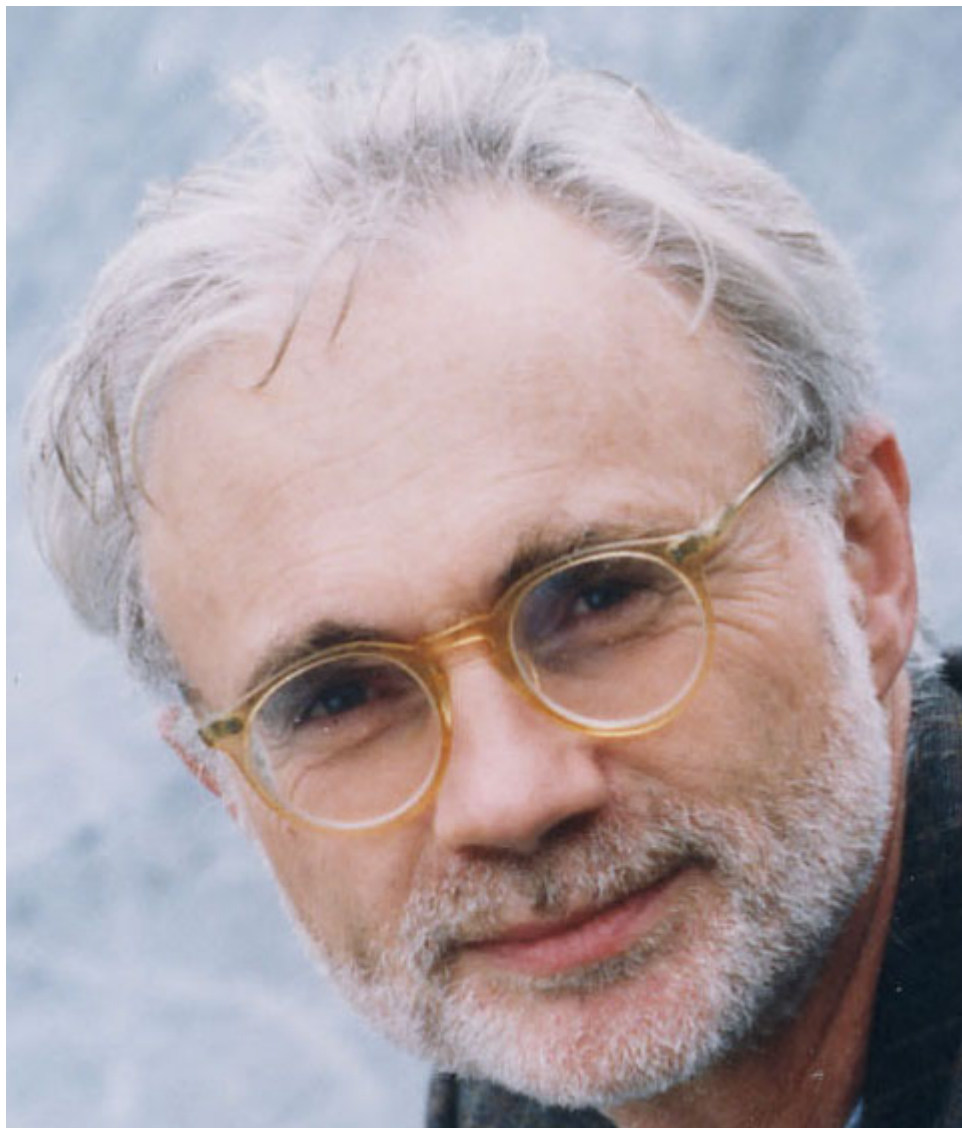
Композитор Джон Адамс