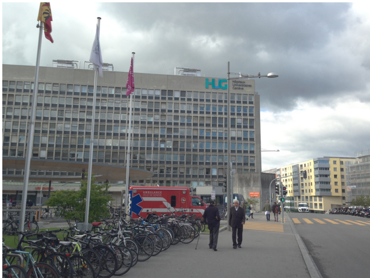
Здание Университетского госпиталя Женевы

Донором пациента Ф. (который находился в соседнем с конференц-залом кабинете с целью сохранения анонимности) стал 75-летний носитель ВИЧ, умерший от кровоизлияния в мозг. Узнав от своего лечащего врача, что швейцарское законодательство разрешает донорство органов в таких случаях, он дал согласие на трансплантацию.