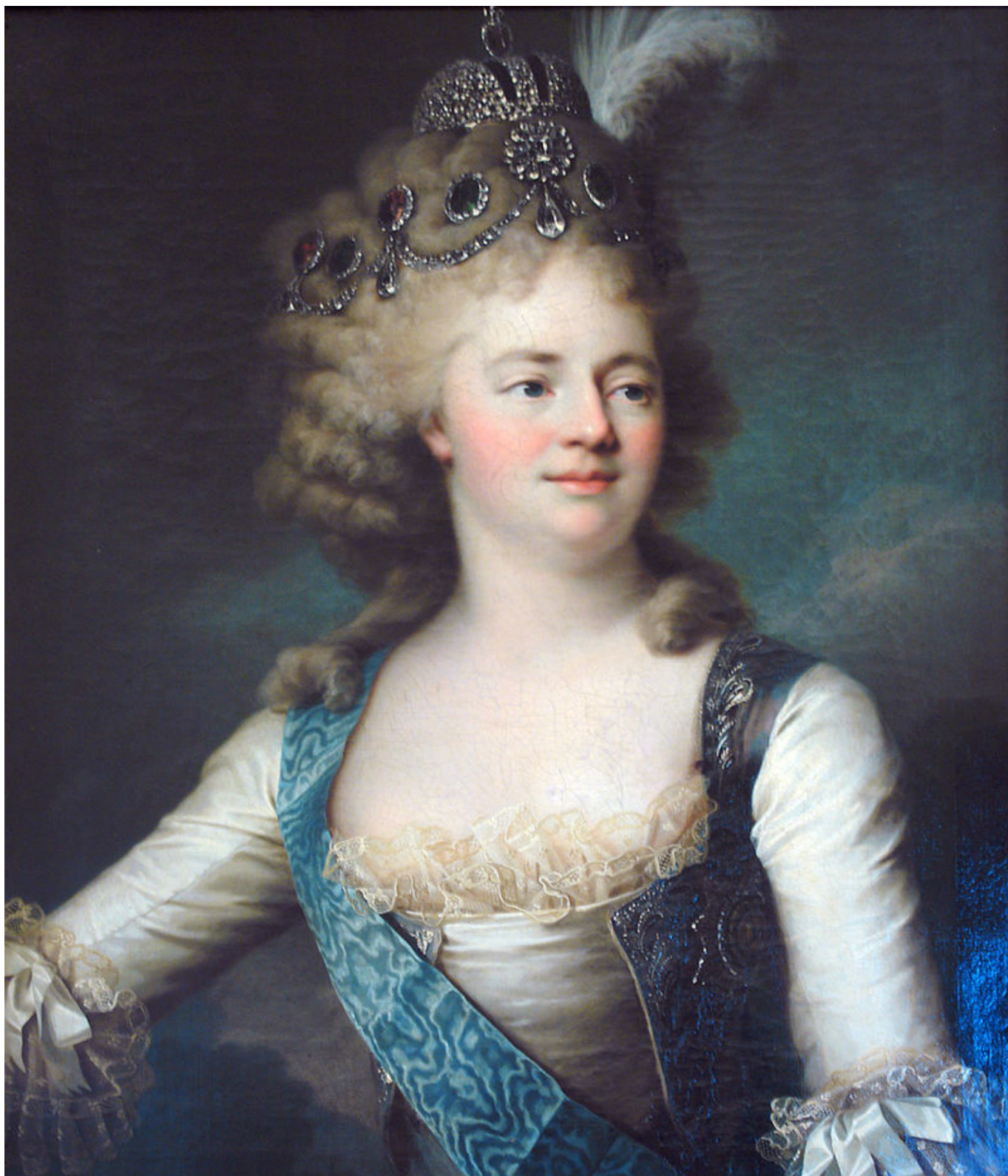
Вуаль Жан-Луи. Портрет великой княгини Марии Фёдоровны (1759-1828), конец 1790-х

Мария Федоровна не только высоко ценила искусство ювелиров Дювалей, но и отдавала должное их деловым и человеческим качествам. До нас дошли ее слова о том, что между Дювалями могут быть только честные люди, так как у них добродетель переходит по наследству. Даже в своем завещании она сочла нужным упомянуть эту семью: «Особенно прошу детей моих не лишать своего покровительства семейство Дюваль, как людей в полном смысле прекрасных». У жены Павла I были все основания дать такую замечательную характеристику