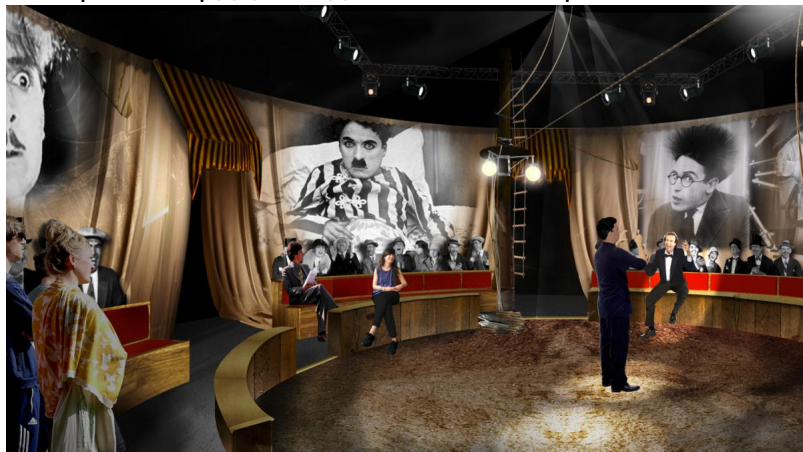
Музей Чарли Чаплина - смех сквозь слезы