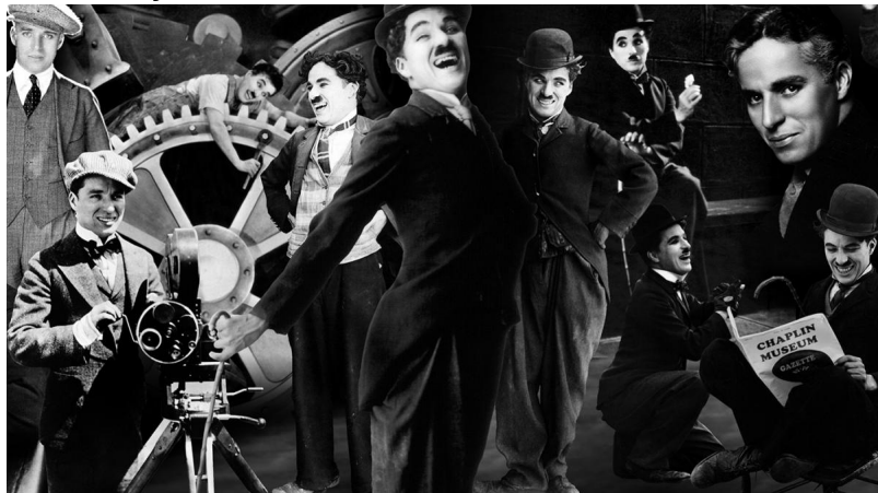
Этот неповторимый Чаплин...

фотографий, личные вещи, а также семейный фотоальбом – все это поможет посетителям ближе познакомиться с мимом, сценаристом, музыкантом, режиссером, монтажником и продюсером. По словам самого Чаплина, тяжелое лондонское детство во многом сформировало его последующий взгляд на людей и общество, а также на свое искусство.