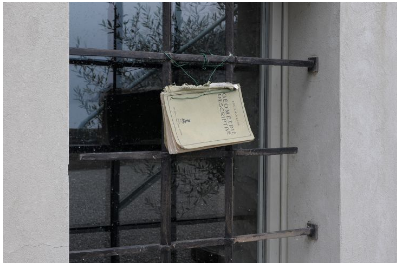
Учебник по геометрии «празднует» столетие дадаизма

Благодаря проекторам на стенах можно увидеть посвященные дадаистам фильмы, документы той эпохи, послушать хроники времен Первой мировой войны. Такая атмосфера позволяет почувствовать душевный настрой неформалов, желавших противостоять бессмысленной жестокости, разрушительному воздействию войны, считавших, что разум и эстетика лицемерно прикрывают первобытные инстинкты в человеке.