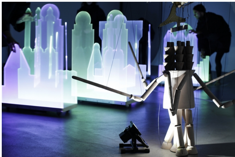
Король-робот, рожденный воображением Дени Савари (fluxlaboratory.com)

А Этнографический музей Женевы готовит представление «Лагуна», идею которого разработал водуазский художник Дени Савари. Центром происходящего станет марионетка по имени The Robot King (англ.: «король-робот»), созданная под влиянием творчества Софи Тойбер-Арп. События разворачиваются в воображаемом городе на воде, декорациями роботу послужат вырезанные из плексигласа дома, которые будут постоянно передвигать по сцене шесть танцоров, создавая иллюзию волнения под действием морских волн. Увидеть спектакль можно будет с 13 по 15 мая.