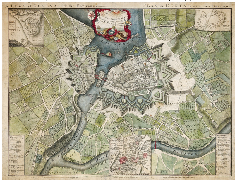
План Женевы и ее окрестностей (dicconbewes.com)

Во время Второй мировой войны германское командование составило план захвата Швейцарии – это был лишь беглый набросок. А швейцарцы продолжали выпускать свои карты, приспособленные под местные нужды: например, карту свиноводства страны. В то время как страны Европы подсчитывали погибших, в Конфедерации считали, сколько свинок выращивают в каждом кантоне, с улыбкой отмечает автор. Таковы были реалии швейцарцев тех лет – страна остро нуждалась в продовольствии. Интересна и советская карта Базеля, составленная на русском языке в 1975 году. Рассматривая девять карт из раздела «Война и мир», можно проследить историю военных конфликтов, в которые была вовлечена страна, и, напротив, – в какие беспокойные периоды она оставалась островком мира в Европе.