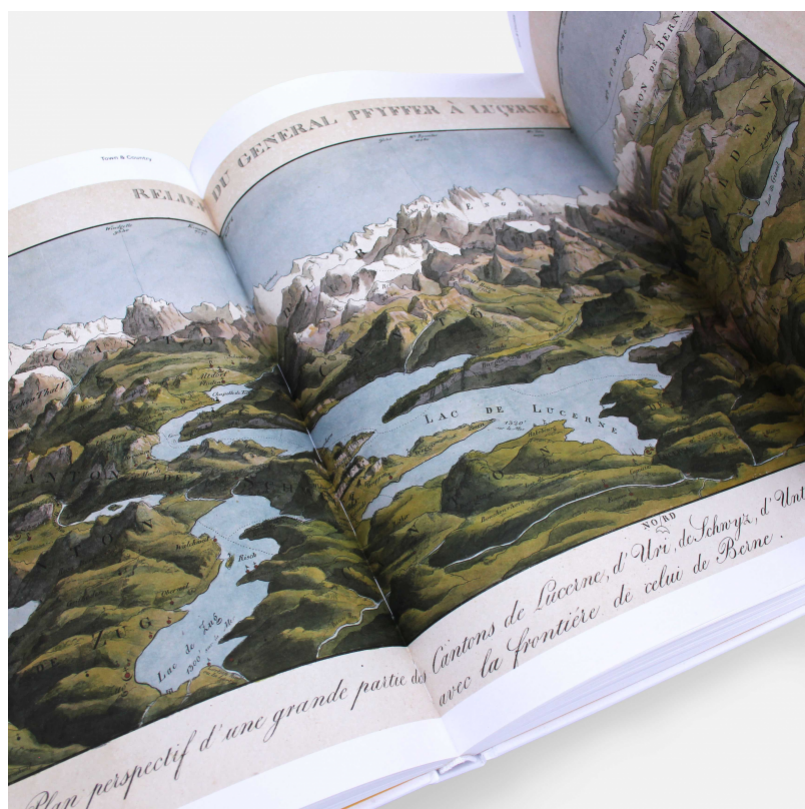
Часть кантонов Люцерн, Ури, Швиц и Унтервальден