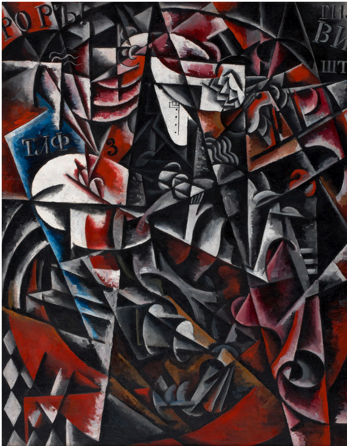
Любовь Попова. «Путешественница», 1915 г. Холст, масло, 158,5 x 123 см, Национальный музей современного искусства, Салоники, Коллекция Костакиса

тем временам равновесие. За исключением Сони Делоне (словно случайно русского происхождения), итальянский и французский авангард остаются исключительно мужскими. Некоторые из участников прославились – как Любовь Попова и Ольга Розанова, работы которые за миллионы расхватывают сегодня любители искусства. Другие известны меньше, например, Надежда Удальцова. От иных остались лишь имена, а все творения исчезли.