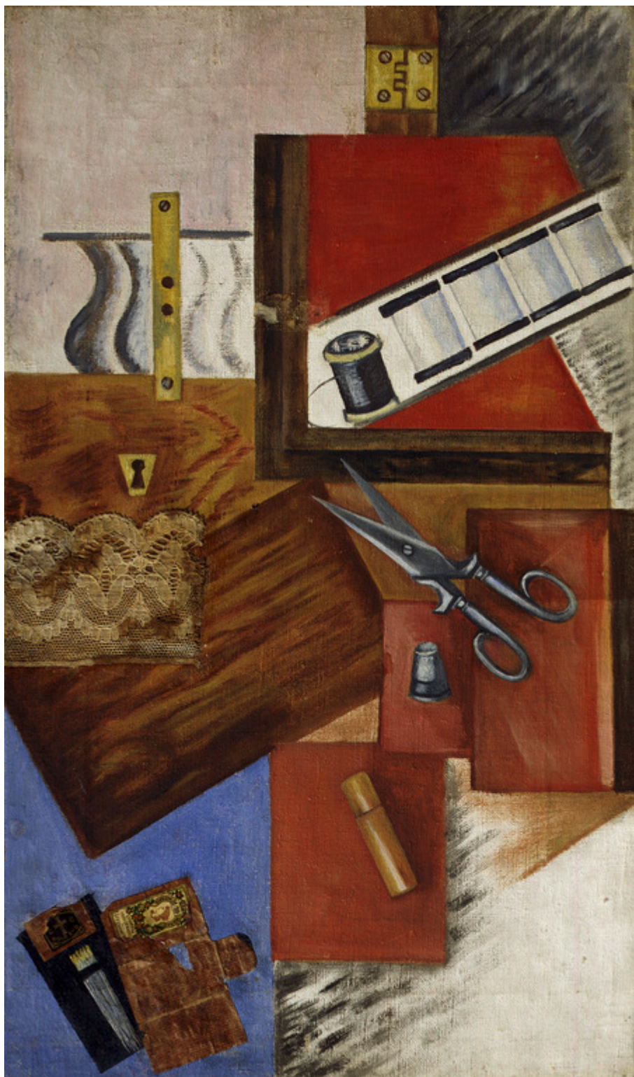
Ольга Розанова. «Рабочая шкатулка», 1915 г. Холст, масло, 58 х 34 см., (с) Государственная Третьяковская галерея, Москва

Очень историческая и очень интеллектуальная, эта выставка впечатляет, но не обязательно трогает. Участники «0,10» не стремились очаровывать. Их целью была радикализация искусства, в скором времени они встанут на службу большевистской революции, которая их истребит. Вот почему Фонд Бейлера предлагает параллельно вторую выставку, в рамках которой «0,10» оказывается начинкой для сэндвича. «Black Sun» отражает влияние такой радикализации на современников участников исторической экспозиции и нынешних художников. Всего представлены 36 авторов, от Василия Кандинского до Дженни Хольцер, Уэйда Гайтона и Олафура Элиассона.