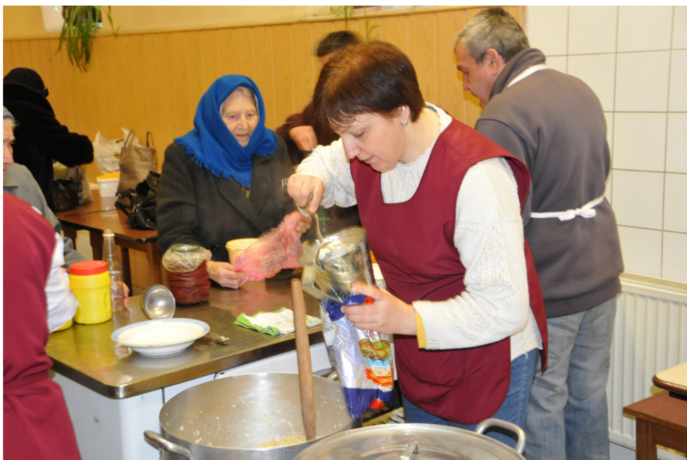
Ежедневное обеспечение горячими обедами двухсот грузинских стариков

Конечно. В России, например, мы поддержали проект, направленный на то, чтобы слепые и глухие люди могли легче находить работу, были бы менее зависимы от окружающих и комфортнее ощущали бы себя в обществе. Сходные цели преследуем мы и в Киргизии, где с подачи JTI создан Центр социальной реабилитации для инвалидов, которым предоставляется не только профессиональное обучение, но и правовая поддержка, проводятся курсы для издателей на языке Брайля. На Украине мы поддерживаем создание центров для пожилых людей, где они получают возможность живого общения и доступ к информационным технологиям, медицинское обслуживание.