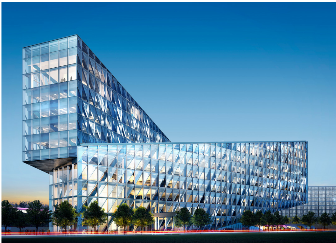
Новый женевский офис JTI

Auteur: Надежда Сикорская, Женева , 28.10.2015.