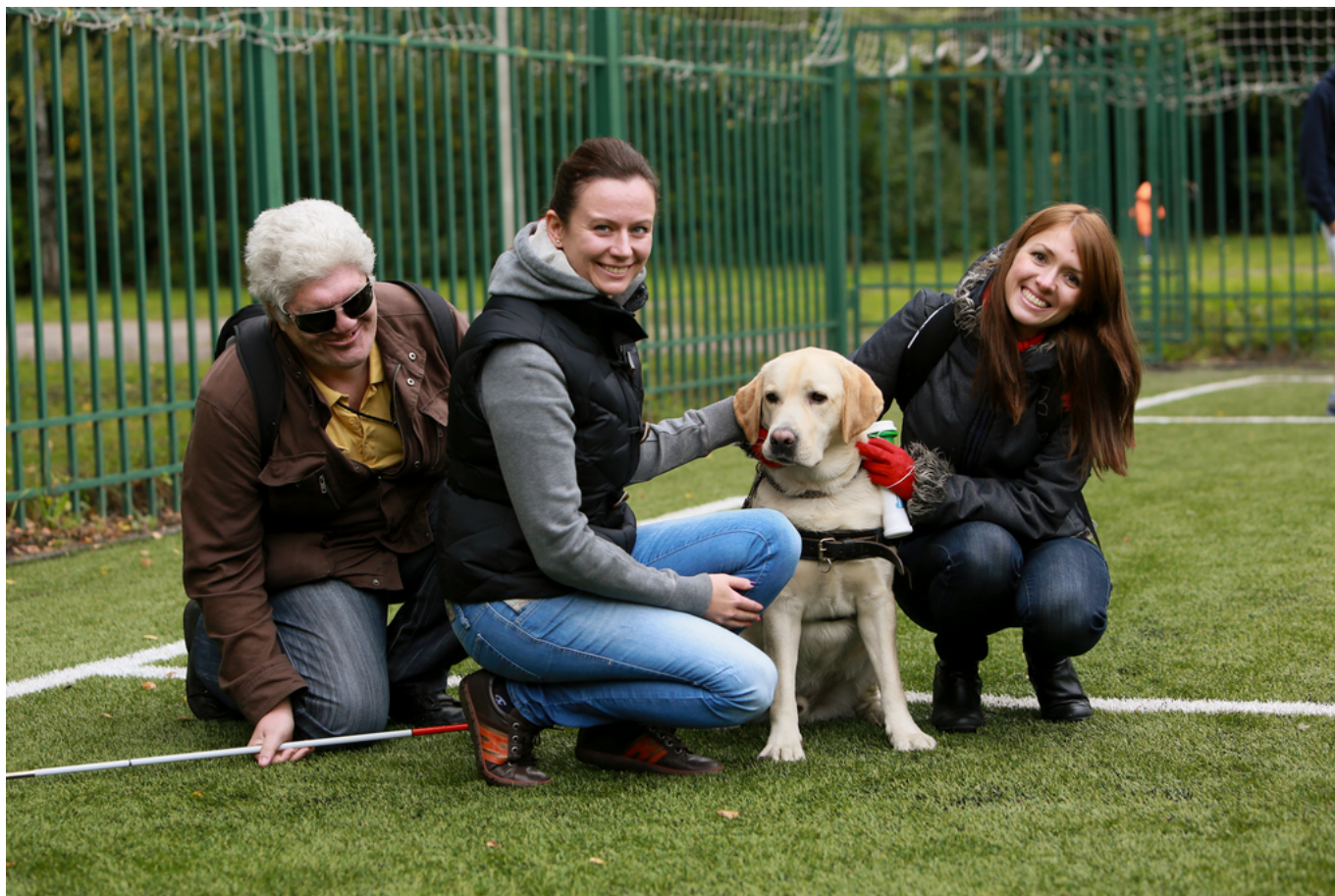
Участники проекта "Собаки-поводыри"

Действительно, в случае с фестивалем в Вербье удалось, хотя бы на пару дней, совместить социальный проект с культурным, но это получается далеко не всегда. В большинстве стран, где работает JTI, мы стараемся активно участвовать не только в социальной, но и в культурной жизни, отдавая себе отчет в ее значимости для гармоничного развития общества, для повышения качества жизни людей. Причем речь идет не только о финансовой поддержке заметных проектов – тут достаточно назвать Эрмитаж, Большой и Мариинский театры в России, Государственный академический драматический театр в Грузии, Национальный исторический музей в Беларуси, Национальный художественный музей Украины, – но и обеспечении доступа к ним тех, кто часто лишен такой возможности не только в силу экономических причин, но и просто из-за удаленности от культурных центров. Такая ситуация характерна для России, известной своими огромными расстояниями. Так вот, в прошлом году мы поддержали очень интересный проект, в результате которого уникальная коллекция старинных немецких гравюр, хранящаяся в Пушкинском музее в Москве, стала доступна не только узкому кругу специалистов, но и любому пользователю Интернета: работы были оцифрованы, теперь, чтобы насладиться ими, достаточно зайти на сайт музея.