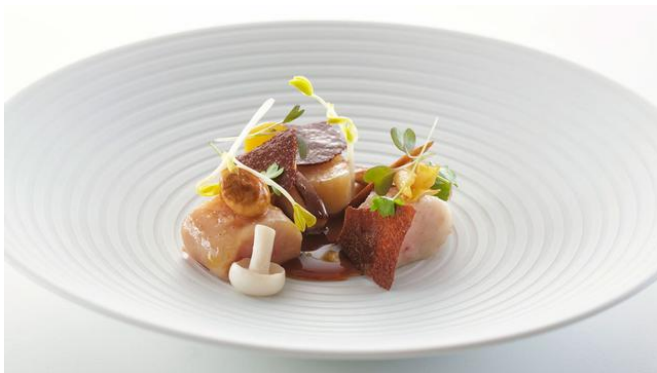
Блюда в ресторане Focus