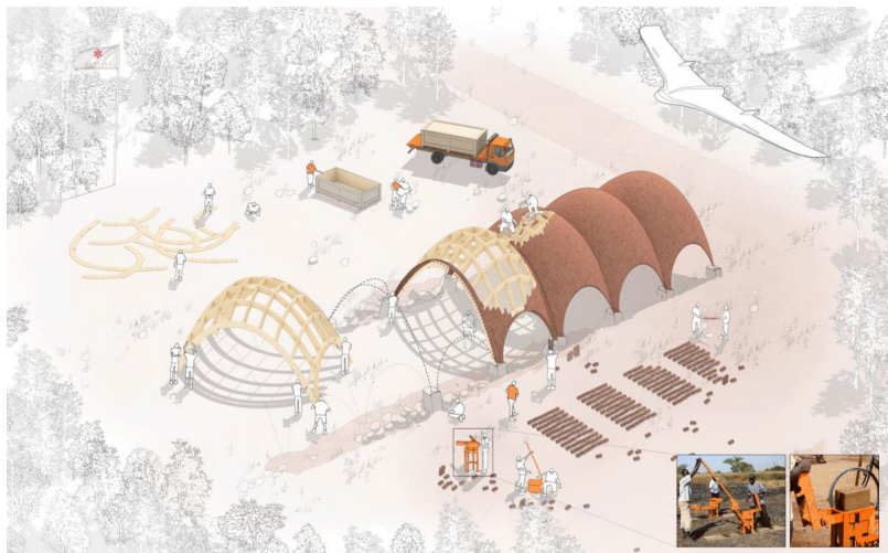
Так будет проходить сооружение

Авторы проекта планируют создать две воздушные трассы: одну – для перевозок лекарств и реагирования в чрезвычайных ситуациях, другую – для торговых грузов. Развитие проекта начнется с использования «Красной линии», а к 2025 году планируется запуск «Голубой линии», по которой устремятся дроны с шестиметровым размахом крыльев и грузоподъемностью до 100 килограмм (они будут возить запасные детали, электронику и другие товары).