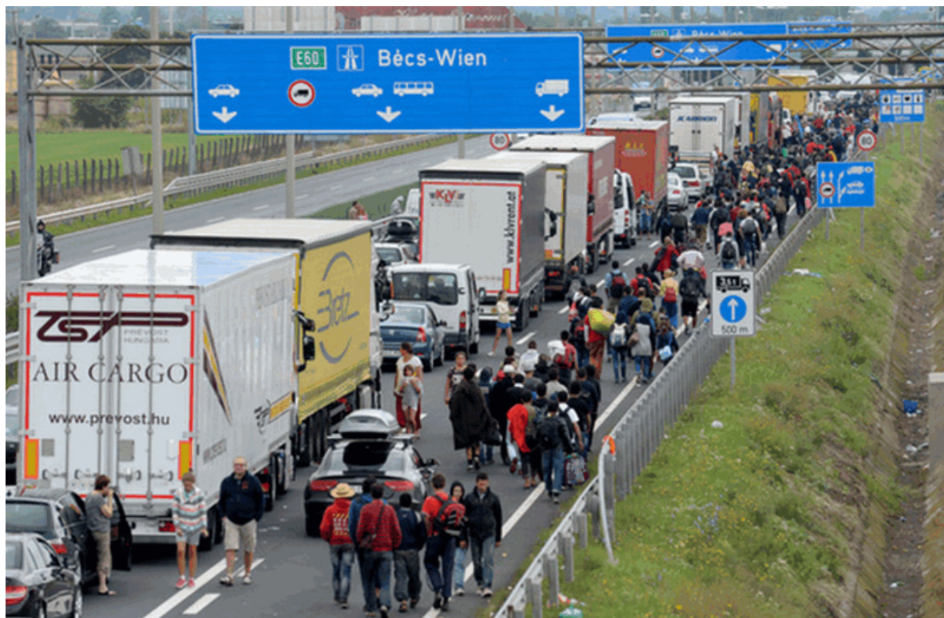
500 человек направляются пешком из Будапешта в направлении Австрии

Однако не все жители Конфедерации готовы принимать новых членов в свою швейцарскую семью с распостертymi объятиями, опасаясь роста преступности, перенаселения и других проблем. Наблюдая за увеличением потока мигрантов, Народная партия Швейцарии (НПШ) предложила ввести годовой мораторий на рассмотрение ходатайств и предоставление приюта всем категориям беженцев, а также восстановить полный контроль над границей. Это предложение в ближайшее время рассмотрит парламент, однако правительство уже отвергло инициативу.