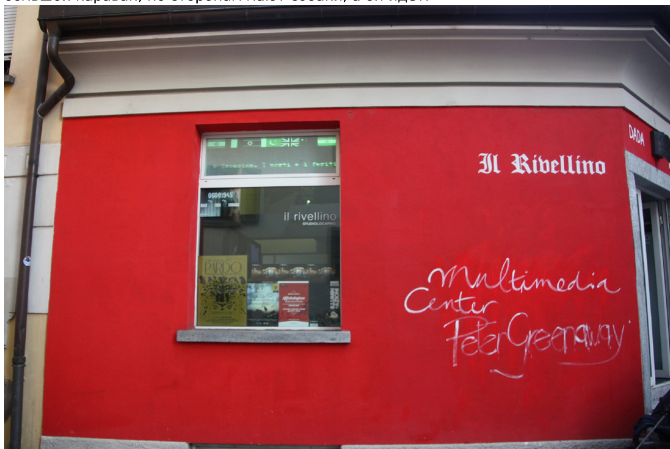
Галерея Il Rivellino

Я не думаю. Культура – это отдельная категория. Как «Госфильмофонд», мы проводим фестивали везде, несмотря на политические отношения принимающей стороны и РФ. В данном смысле культура вне политики. Конечно, есть страны, которые хотели бы распространить напряженность и на культурные отношения, но необходимо четко и сразу сказать – Россия не даст себя в это втянуть... Россия – это большой караван, по сторонам лают собаки, а он идет.