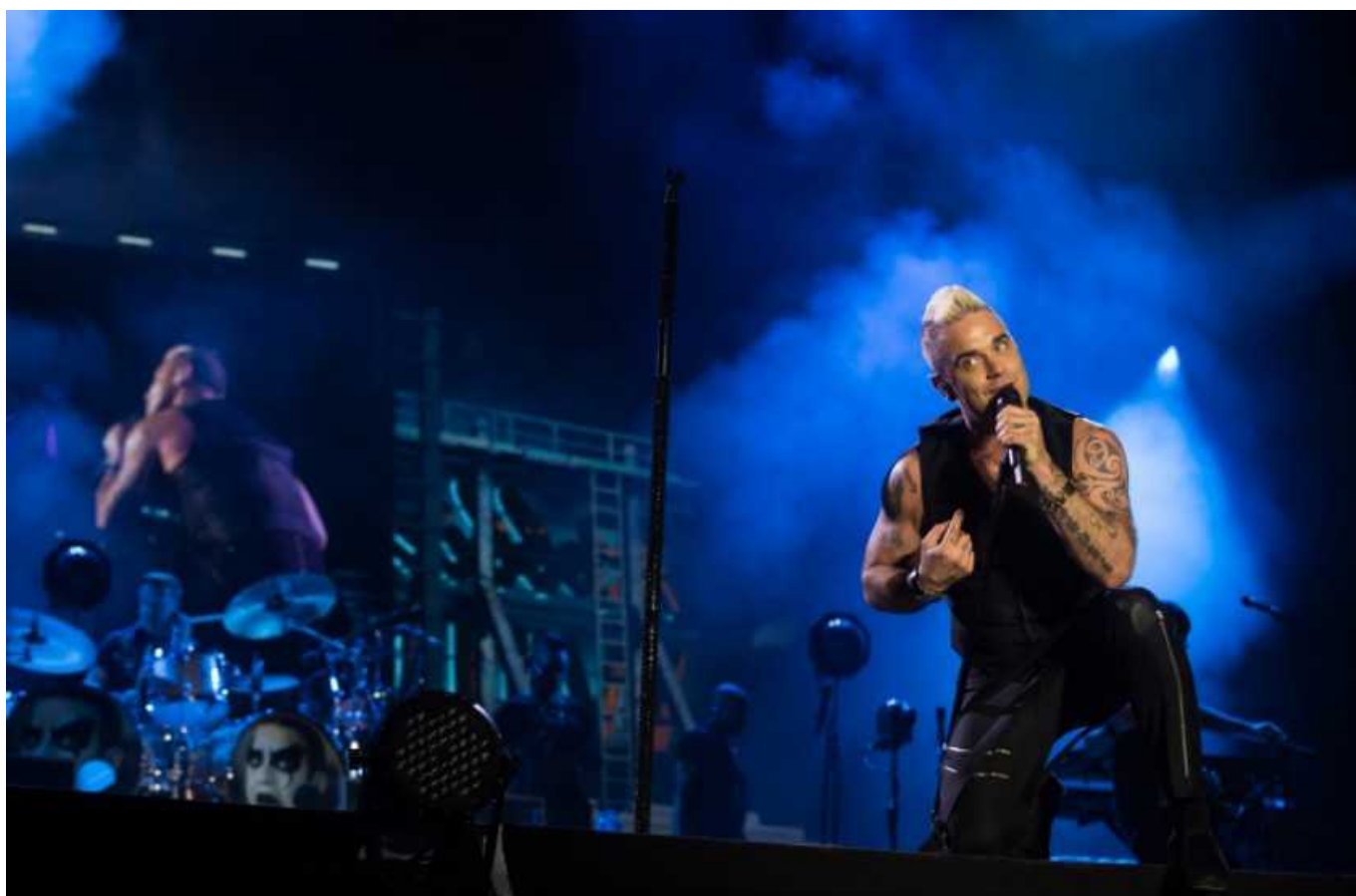
Робби Уильямс

Народ хотел зрелища, и он его получил. Чего стоило только первое появление на сцене под аккомпанемент знаменитой «O Fortuna» из кантаты Карла Орфа «Carmina Burana». А затем последовал хит «Let me entertain you», быстро подхваченный толпой. Уильямс «развлекал» зал композициями из нового альбома и уже хорошо известными песнями, но по-настоящему он раскрылся, когда тихо и спокойно затянул «My way» из репертуара Синатры.