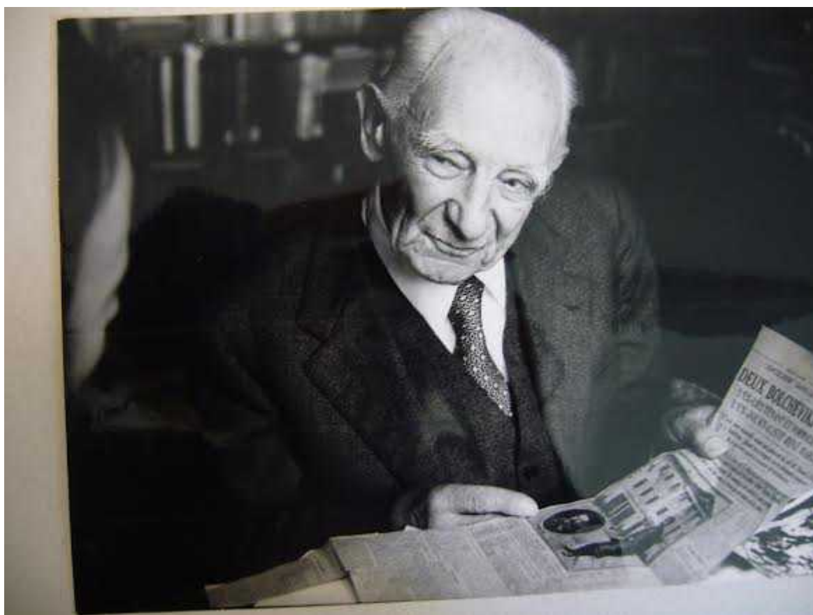
Пьер Паскаль, большевик и католик

Auteur: Жорж Нива (пер. Н. Сикорской), Лозанна , 17.06.2015.