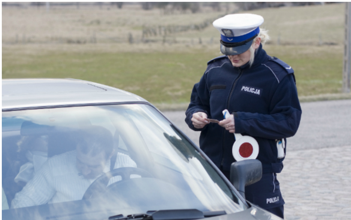
Совместный проект "Безопасность на дорогах" в Польше

В целом действующая система контроля доказала свою эффективность, считают эксперты, обращая внимание лишь на отдельные недостатки. В частности, при реализации одного из проектов в Венгрии контролирующими органами была пресечена попытка мошенничества на сотни тысяч франков. Этот случай не имел прямой связи с участием Швейцарии, поскольку в тот момент работы находились на стадии предварительного финансирования страной-партнером.